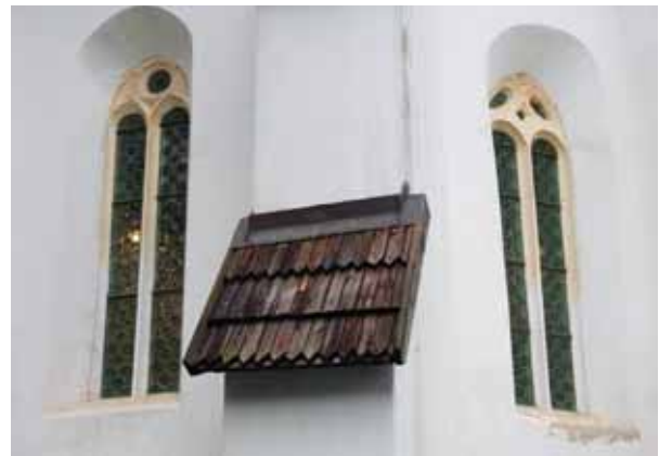
2. Mérműves ablakok a szentélyen

A falusi méretekkkel rendelkező, keletelt templom kisebb változtatásoktól eltekintve ma is középkori alakjában áll. 2 Ez az épület azonban nem azonos a XIV. századi forrásokból ismert kápolnával, melynek alapfalait részben a mai alatt, részben tőle délre az 1980-as évek-