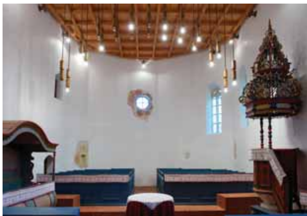
3. A templom belseje kelet felé

Meglehetősen szerény képet mutat a templom kevés középkori részlete. Lábazata és főpárkánya már nincs az épületnek. A valószínűleg 1936-ban, cementből készült előbbi a legutóbbi felújítás során távolították el, a főpárkányt pedig szintén a két háború közötti munkálatok alkalmával bonthatták vissza a falkoronával együtt. 9 A templom jelenlegi nyugati bejárata is az 1936-os felújítás eredménye, de e helyen a korábbiakban is volt már