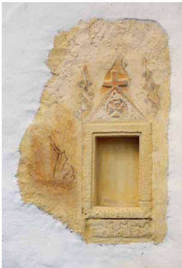
4. Szentségház a szentély északkeleti falán

maradtak fenn eredeti ablakok. A kívül félkörösen, a mérműnél csúcsívesen záródó, rézsús bélletű nyílások kőből készültek, s kétosztatúak. 16 A bizonytalan formájú és fel-tűnően gyenge kivitelezésű, kört és halhólyagszerű formát mutató mérművek egyetlen kőlapból vannak kifaragva. 17 A szentélyzáradékon látható körablak a falhoz képest utólagos kialakítású, nehezen értelmezhető, furcsán elhelyezett hengertagjai vakolatból készültek. 18 Az 1980-as években történt kutatások során előkerült a sekrestye