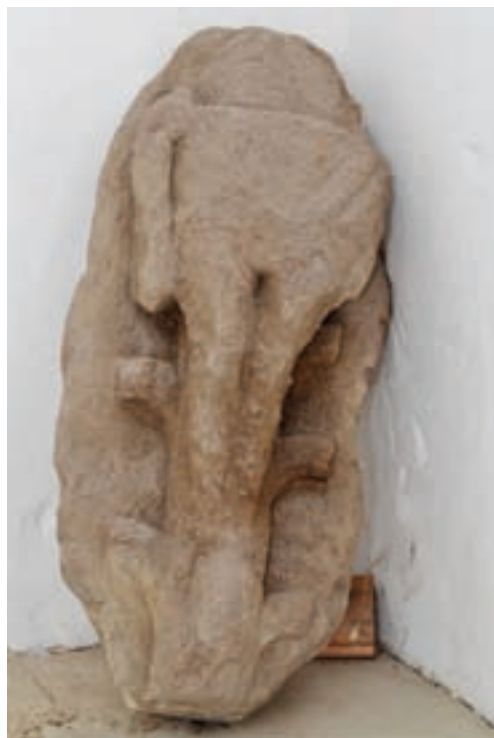
16. Figurális töredék a Vármúzeumban

zül az egyik egy boltozati zárókő (14–15. kép). Kiterjesztett szárnyú madarat ábrázol, amelynek feje erősen megkopott. A bordázott, tollakat utánzó erős szárnyak között írásszalag, rajta IOH(ANNES) felirattal. Az írásszalag szárnyak alól kibukkanó végei tekercsben végződnek. A zárókő két oldalán a hozzá csatlakozó borda illeszkedési helye jól látható. Ábrázolása (sas) és a felirata egymást erősítve Szent János evangélistára utal. A másik faragvány álló alakot ábrázol, amely kezeivel szétnyitott irattekercset tart, amelyen valaha felirat volt (16. kép). A nagyon megrongálódott kő eredetileg boltozat bordaindításának konzolos eleme volt. A szürke homokkőből faragott mindkét kő csak a templom szentélynégyzetéhez – s nem