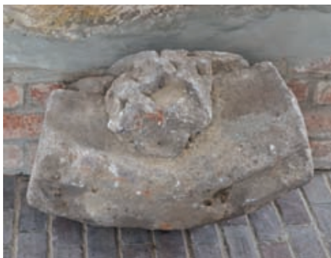
15. Boltozati zárókő a Vármúzeumban

A kisvárdai vár délkeleti tornyának első emeletén ma is látható az az 1961-ben készített kiállítás, amely részben a vár ásatásakor (1954, 1957, 1960) előkerült, részben a katolikus templomot övező kerítésből 1953-ban kibontott faragványokat mutatja be a vár, illetve a város történetébe ágyazva. Öt faragott kő hozható kapcsolatba a középkori templomépülettel. Egy boltozati bordatöredék és a lábazatkő a vár ásatása során került elő, mégpedig a keleti épületszárny helyén, tehát ott, ahol egykor a vár kápolnája állt. Ezek egyaránt készülhettek mind a középkori plébániatemplom, mind a várkápolna részére. A másik három, a kerítésből kibontott kövek között van Várdai Pelbárt 1438-ból származó sírkőve, amelyről tudjuk, hogy egykor a r. k. templom hajójában állt sírt fedte. (Ld. kötetünkben Lővei Pál tanulmányát.) A másik két kő kö-