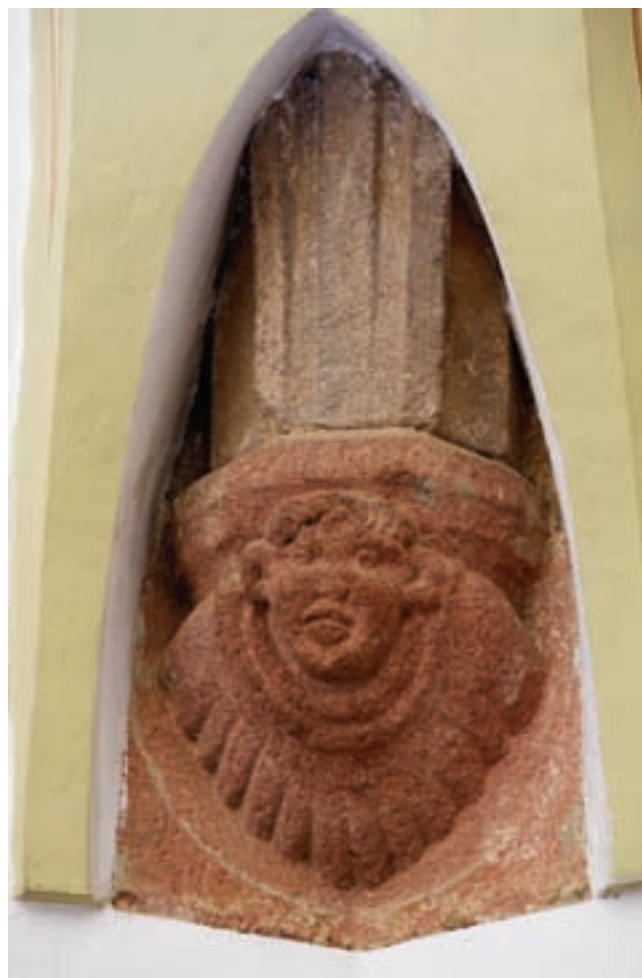
8. Konzol a szentélyben