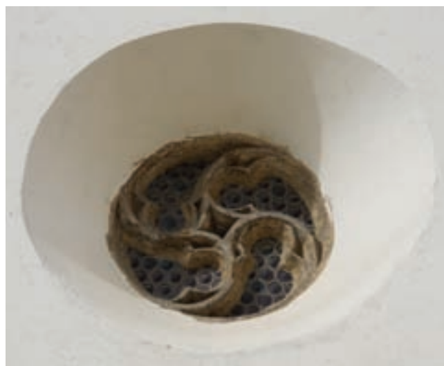
4. Körablak a szentély keleti falán

A szentélyfej és benne a konzolok korára a város műemlékeinek kiváló ismerője, Éri István a XV. század közepét vagy annak második felét adta meg. 9 Németh Péter megpróbálta a konzolfejeket megszemélyesíteni. A templom védőszentjeit követő koronás főben Zsigmond királyt, a Várdai család legfőbb patrónusát látta. 10 Ma már nem egészen így véljük. A királyfej nem bibliai figura, de olyan szent, akinek köze van Zsigmondhoz: az V–VI. században