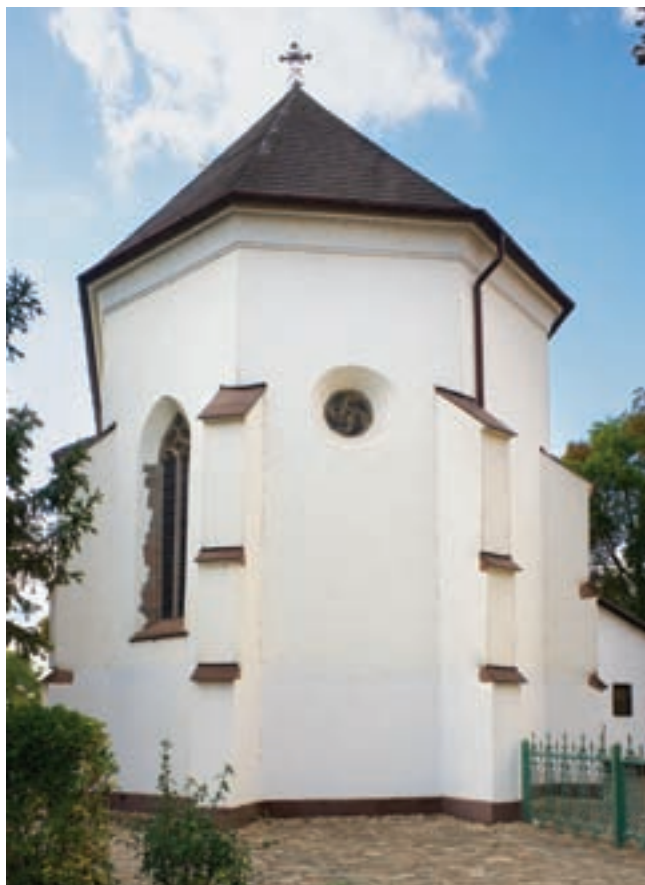
3. A templom kelet felől

dezett palást fedi (10. kép). Az ábrázolás az értő szemet a középkori Szent László-reliktumok legismertebbje, a Szent László-hermára emlékezteti. Az eredetileg valószínűleg trapéz végződésű bordák szürke színű kőből faragott indításai a konzolok fölött láthatók.