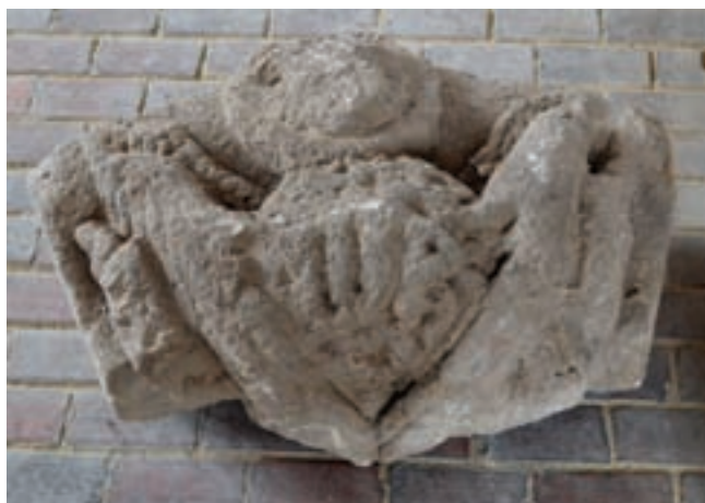
14. Boltozati zárókő a Vármúzeumban

szemöldökgyámos megoldású – élszedések közrefogta hornyok és erőteljes pálcából álló tagozatos - nagyméretű kapuzat vállának rétegekőve, míg a másik talán egy ablak nagyméretű hornyos bélletkőve lehet (13. kép).