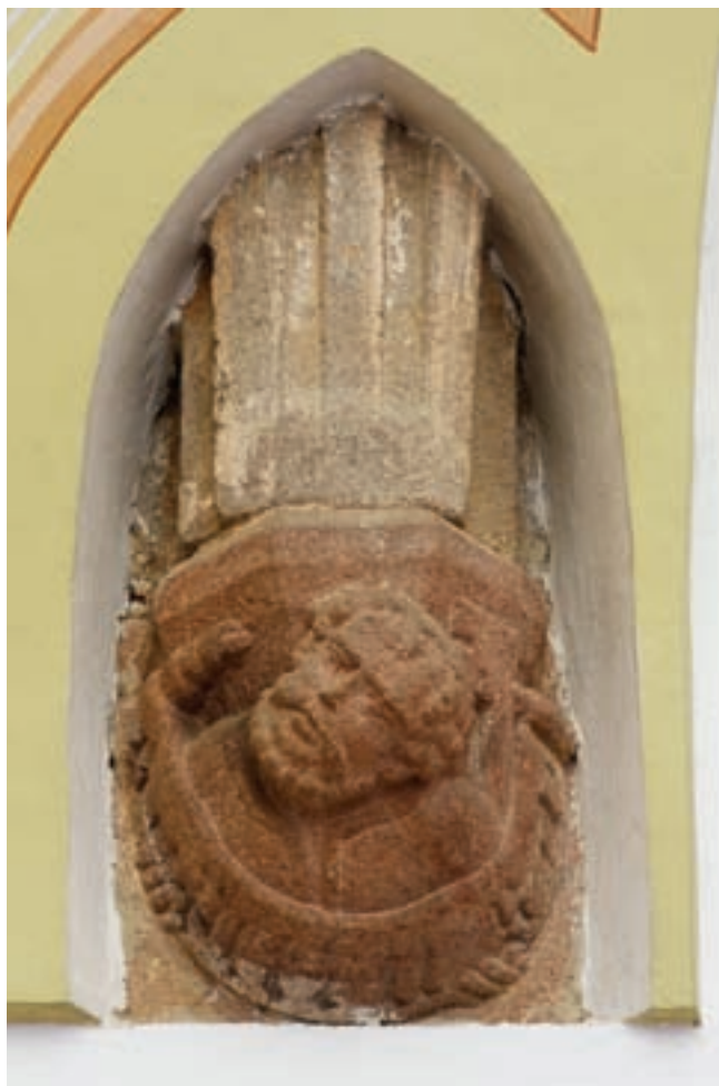
5. Konzol a szentélyben (Szent Péter)