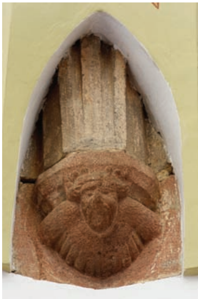
7. Konzol a szentélyben

Ez az állapot azonban nem tarthatott soká, a kisszámú katolikus hívó a vár belső, majd külső, Szentháromság