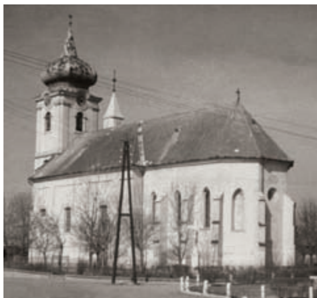
2. Összkép délkeletről, a helyreállítás előtt

ható felirat ( S. Paulus ) is megerősíti (6. kép). A szentély keleti oldalán elhelyezkedő három konzol nem visel feliratot, így a figurák meghatározása nehéz. Első említőjünk, Ipolyi Arnold szerint „bibliai és legendai alakokat” ábrá-