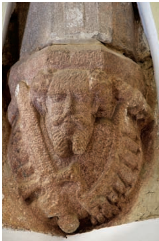
6. Konzol a szentélyben (Szent Pál)