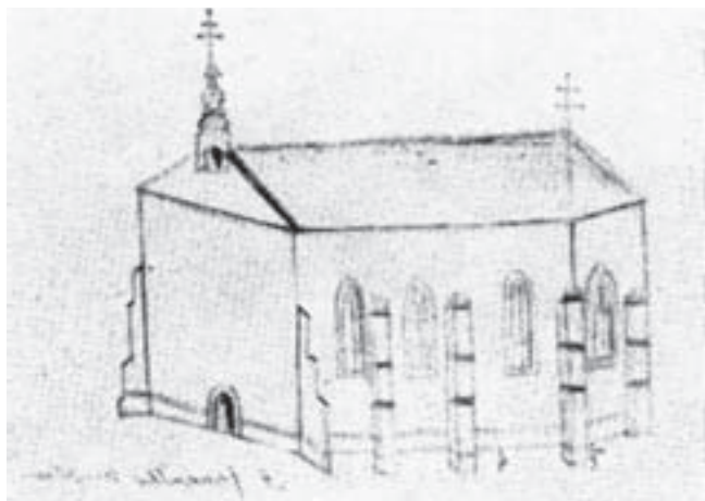
11. A templom 1779-ben

záródó szentségtartó fülke került elő. A fülke kőkeretes, külső oldala erősen, egészen a falsíkig visszavésett. Így csak feltételezhetjük, hogy milyen tagozata is lehetett. A kevés nyomból ítélve úgy tűnik, hogy szárainak, valamint záródásának belső szélén egyszerű, körbefutó élszedés húzódhatott, amelyet 5–6 cm-rel a fülke könyöklője felett egyszerű ferde síkkal zártak le. A kőkeretnek a fülke záródásánál tapasztalható megvastagodása talán az egykori díszítésre utalhat. Mindenesetre a záródás feletti két 15 cm széles téglának erősen megfaragott felülete ezt a feltevést erősíti meg. Az építkezés során a fülke helyét először kifalazták, majd a kőelemeket a már kész fülkébe helyezték el – hát- és oldalfalait vékonyan kivakolták és meszelték. 27