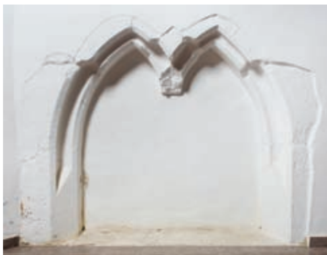
12. Ülőfülke a szentélyben

A délkeleti falban, a padló felett 24 cm-re egy enyhén csúcsívben végződő, kisméretű fülke látható, amelyről megállapítottuk, hogy a falhoz képest másodlagos kialakítású. 28 A bélletében és a hátlapján húzódó vakolat szürke cementes. Ennél korábbi vakolatot nem figyeltünk meg.