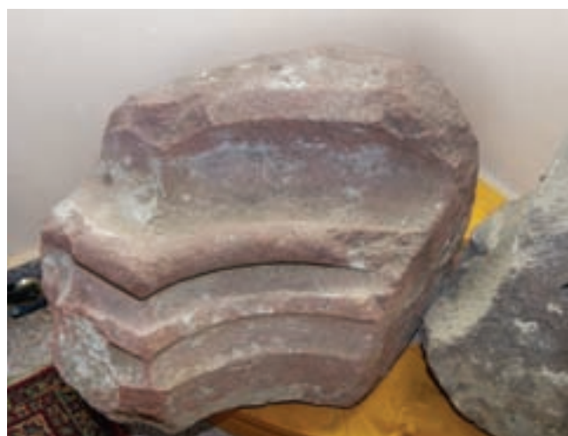
13. Kapuzat töredéke a templom előterében

Közvetlenül a délkeleti saroknál egy kőkeretes, (kettős) kegyúri ülőfülke került elő (12. kép). A kettős csúcsívvel lezárt bélletes fülke ülőpadja szintén kőből faragott. A konzolokról indított csúcsíveket szemöldökgyám fogja össze, melynek felülete erősen roncsolt. A lefaragás körvonalából következtetve joggal gondolhatunk arra, hogy a konzol levéselt felső része a Gutkeled nemzetség – ahova a Várdaiak is tartoztak – farkasfogas/ékvágásos címerpajzsát ábrázolhatta. A kőkeret tagozatát élszedések közrefogta mély és széles horony alkotja. 29 Hátoldala, valamint kávéja téglá, melyeket több rétegű fehér, illetve sárgásfehér meszelésű vakolat fed. A három – az északi és a déli falon megfigyeltekkel megegyező anyagú – vakolat kétségkívül középkori, ám a máshol megtalált negyedik réteg a fülke hát- és oldalfalairól már hiányzik. A kőkeret szélén, kb. 5 cm-es sávban, egy szürkésfehér meszelés látható, amely a kőkeret legfelső, fehér meszelésű rétegéhez kapcsolódik. A keleti csúcsíves záradék feletti felületen egy kiterjedt, vörös színű vakolat is látszik, amelyet azonban nehezen tudunk értelmezni.