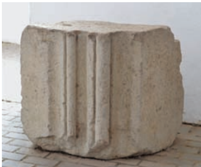
17. Ajtókeret réteggöve a Vármúzeumban

A kisvárdai római katolikus templom elődjét a XI. század végén I. (Szent) László király építtette, ennek azonban az alapjait csak régészeti kutatás hozhatná a felszínre. A tatárjárás (1241) pusztításait ez az épület sem kerülhet-