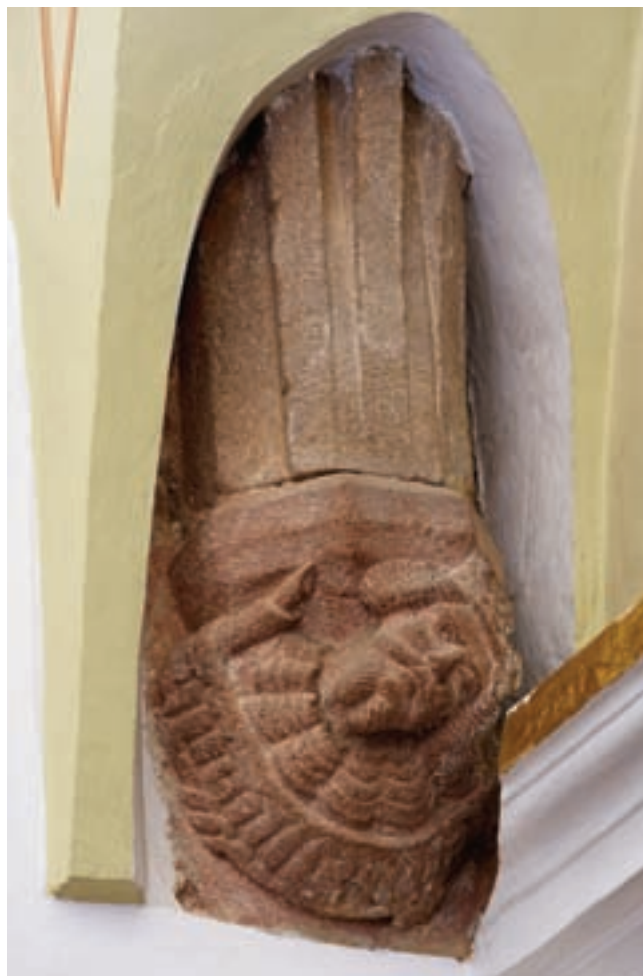
10. Konzol a szentélyben ( Szent László?)

tiszteletére szentelt kápolnájában talált imahelyre. Ám a reformátusok sem élvezték soká a kezükre jutott templom békéjét. 1673-ban egy fosztogató rablóbanda a várost felgyújtotta, a templom leégett, s bár a szentély falai erősen megrongálódva, de épen maradtak, ám abban mi-sét hallgatni már nem lehetett. 20