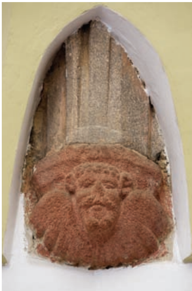
9. Konzol a szentélyben