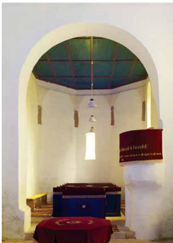
4. A szentély belseje nyugatról

homorlatból, vékony pálcával indított félkörtagból, félhomorlatból és rézsús lemeztagból áll. A tagozatok alul a lábazatot záró rézsús felületről indulnak, a záradékban a profil élei többszörösen átmetsződnek egymáson. A hajó déli falát két ablak, s ma a torony belsejében elhelyezkedő ajtó tagolja. Az ablakok kialakítása, méretei és elhelyezkedésük megegyezik: csúcsívesek és kétosztatúak, béléstük rézsús és záradékukban mérmű látható. Az orrtaggal nem bővített mérművek formája majdnem azonos: a nyílásokat lezáró csúcsíves felett újabb csúcsíves, illetve a keletinél mandulaszerű forma jelenik meg. Utóbbit a záradékig felfutó osztópálca tagolja. 10 A déli kapu szintén csúcsíves, keretének elpusztult jobb felét fával pótolták ki. Profilja a nyílás felé rézsús lemezből, félpálcagból, homorlatból és újabb rézsús lemeztagból áll. Ez utóbbi tagozat a záradékban átmetsződik egymáson. A hajó északi fala tagolatlan. A szentély déli falán a hajóéval mindenben, még mérműformájukban is megegyező két ablak látható. 11 A szentély záradékfalán kis méretű, vékony ablak jelenik meg, belsejében téglából kialakított, sátozottós záradékkal, béléstében pedig szegmensívszerű lezárással. 12 A szentély északi falán előkerült a sekrestye ajtónyílása. 13