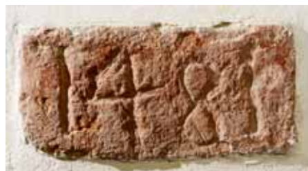
1. Évszamos téglá a szentély északi falának belső oldalán

A Szamos partján fekvő, a XIV. század utolsó negyedéig királyi kézben lévő település első ismert említése egyházzal kapcsolatos. Az 1332–1334-es pápai tizedjegyzékek Tamás, majd Péter nevű papját említik, s így az erdélyi püspökség ugocsai főesperességének a területére eső faluban ekkor már kellett állnia templomnak. Ezen túl nem ismert több középkori említése a település egyháznak. 1 Az 1980-as évek első felében, a templom felújítása során azonban ismeretlen helyről előkerült egy téglá, melybe a felületet majdnem teljesen kitöltő 1481-es évszám van belevésve. 2 A hajó egy 1638-as felirata alapján az akkor helyreállított épületet a Szentháromság tiszteletére szentelték újjá, s nem kizárt, hogy középkori titulusa is ez volt. 3