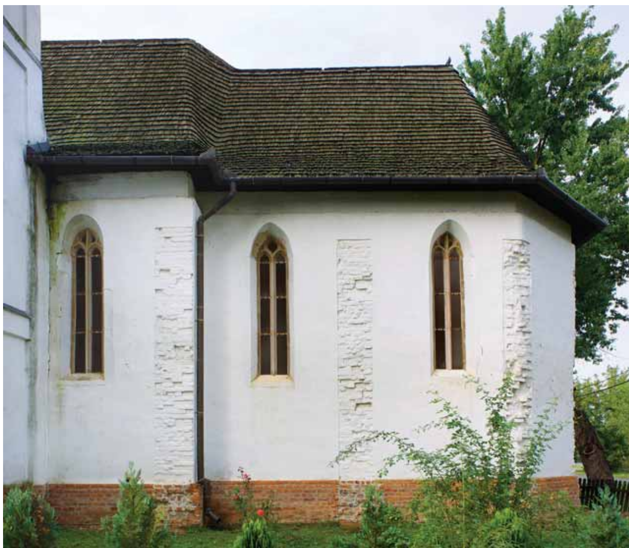
5. A templom keleti része délről

A hajó belsejében az eddig leírtakon túl nincs középkori részlet. A falkutatás alapján egyértelmű, hogy a templomnak ez a része eredetileg sem volt boltozott. 14 A diadalívet téglából falazták, északi pillérének homlokoldalán íves záródású lábazat volt megfigyelhető a kutatás során. A vállvonal felett a diadalív félköríves záródása újkori beavatkozás eredménye; középkori formája ismeretlen. 15 A szentély északi falának nyugati felén látható a sekrestye befalazott ajtajának csúcsíves, élszedett profilú kőkerete. A déli fal keleti ablaka alatt kisméretű, sátozott lezárású fülke mélyed a falba. A szentély egykori boltozatának lenyomatai és lefaragott indításai előkerültek a körítőfalon. Ezek alapján a bordák valószínűleg visszametszéssel indítva váltak ki a falsíkról, s állítólag kétszerhornyolt profiljuk is megfigyelhető volt még a lefaragott felületeken. 16