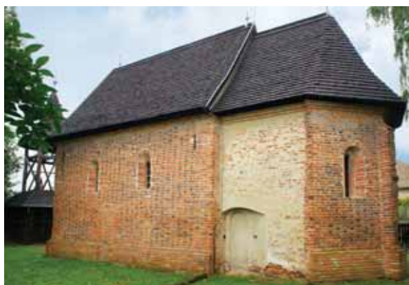
3. Délkeleti nézet