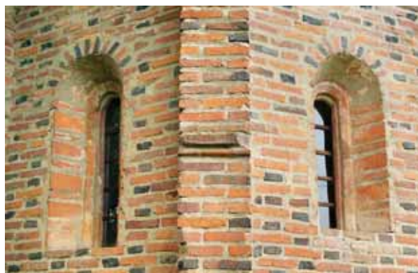
5. Ablak- és párkányformák

A másik jellemzője a korai fázisnak az idomtégla használata. A támpillérek esővetői részsűből, lemezből és félpálcából állnak; a lábzatok két lépcsője közül az alsó élszedéses, a felső a szentély körül élszedéses, a hajófalon negyedhengertagos. A párkány alsó téglasora szintén negyedhengertaggal bír. A legfinomabb kivitelű a szentély ablakainak belső rétege.