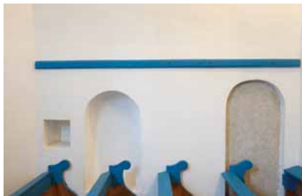
6. Ülőfülkék és befalazott sekrestyeajtó a szentély déli falában

Ennek alapján úgy tűnik, a templom nagyrészt egy periódusban készült. Megerősíti ezt Czeglédy Ilona ásatása is, aki egységes építési idejűnek találta az alapozást. 33 Ennek során épült fel polikróm falazással és idomtégla felhasználásával a sokszögzáródású, vélhetőleg boltozott szentély, az ehhez délről kapcsolódó sekrestye és a bolto-