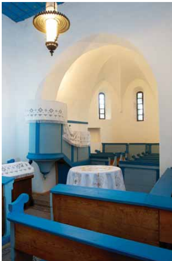
4. A templombelső északkelet felé

tették, visszaállítva ezzel a középkori talajszintet, és a szemöldökívet kiegészítették. 30