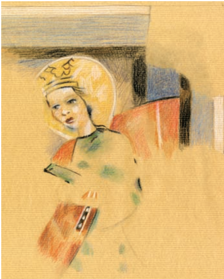
5. Női szentet ábrázoló falkép (színes caruzarajz)

1744-ben a templomot – mivel az elpusztult – nem használják. 15 Úgy tűnik, hogy néhány évre rá egy nagyobb szabású építkezésbe fogtak. A XVIII. század közepén történt építészeti beavatkozás eredményeként elbontották a középkori szentélyt. Annak helyére egy nagyobb alapterületű, a hajó szélességével és magasságával megegyező kriptát építettek (6. kép). 16 Elbontották a középkori diadalívet és a hajó északkeleti támpillérét is. Bizonyos, hogy a hajó lizénáit is ekkor faragták vissza (7. kép). A statikailag meggyengült északi hajófal elbontott keleti pillérének helyére egy, az új szentéllyel összekapcsolt pillért is fölfalaztak, a déli hajófal keleti pillérét pedig köpenyfallal burkolták. A középkori szentély és diadalív elbontásakor az oromfalat, és ezzel egyetemben