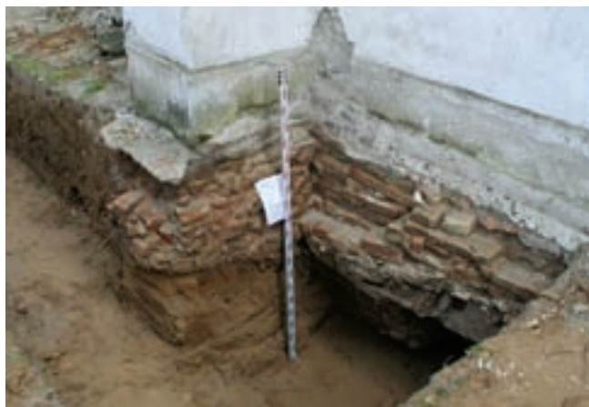
6. A hajó északkeleti vége és a szentélyfal csatlakozása