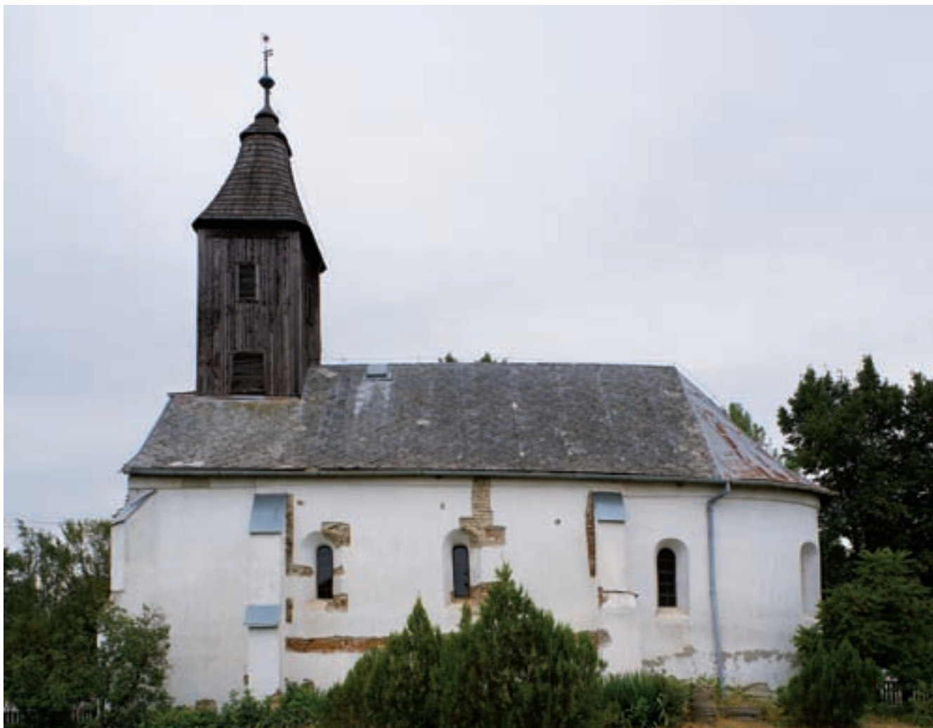
2. A déli homlokzat kutatás közben

mélységét, az elbontott pillérek és falak helyét, valamint méretüket és a felmenő falazatokhoz kapcsolódó viszonyukat is meghatároztuk. 1