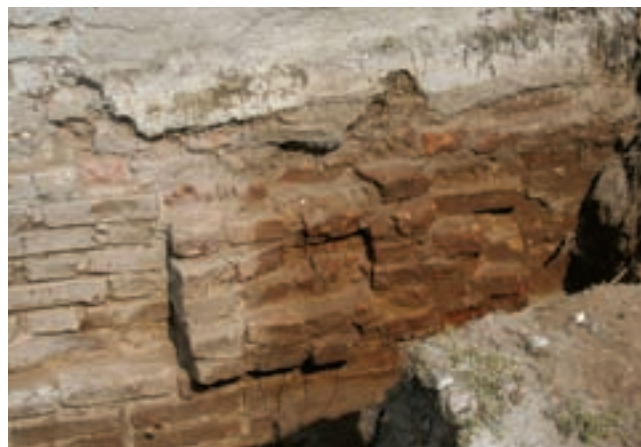
7. A középkori déli hajófalnál feltárt lizéna

a hajó mennyezetét, sőt fedélszékét és annak borítását is el kellett távolítani.