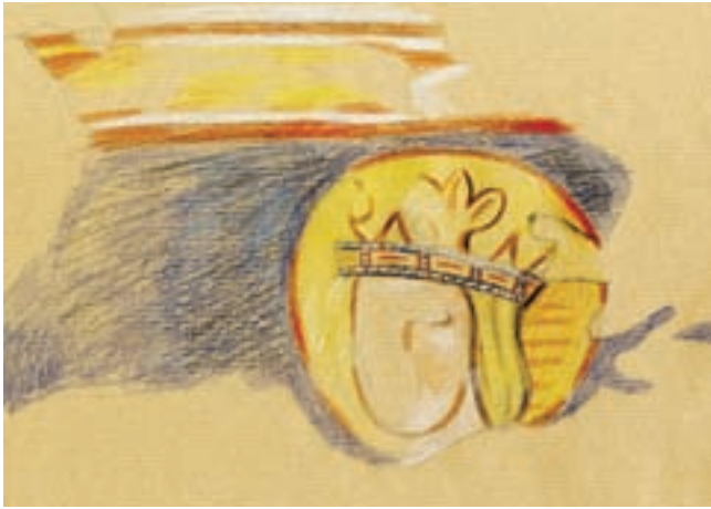
4. Női szentet ábrázoló falkép (színes caruzarajz)

1744-ben a templomot – mivel az elpusztult – nem használják. 15 Úgy tűnik, hogy néhány évre rá egy nagyobb szabású építkezésbe fogtak. A XVIII. század közepén történt építészeti beavatkozás eredményeként elbontották a középkori szentélyt. Annak helyére egy nagyobb alapterületű, a hajó szélességével és magasságával megegyező kriptát építettek (6. kép). 16 Elbontották a középkori diadalívet és a hajó északkeleti támpillérét is. Bizonyos, hogy a hajó lizénáit is ekkor faragták vissza (7. kép). A statikailag meggyengült északi hajófal elbontott keleti pillérének helyére egy, az új szentéllyel összekapcsolt pillért is fölfalaztak, a déli hajófal keleti pillérét pedig köpenyfallal burkolták. A középkori szentély és diadalív elbontásakor az oromfalat, és ezzel egyetemben