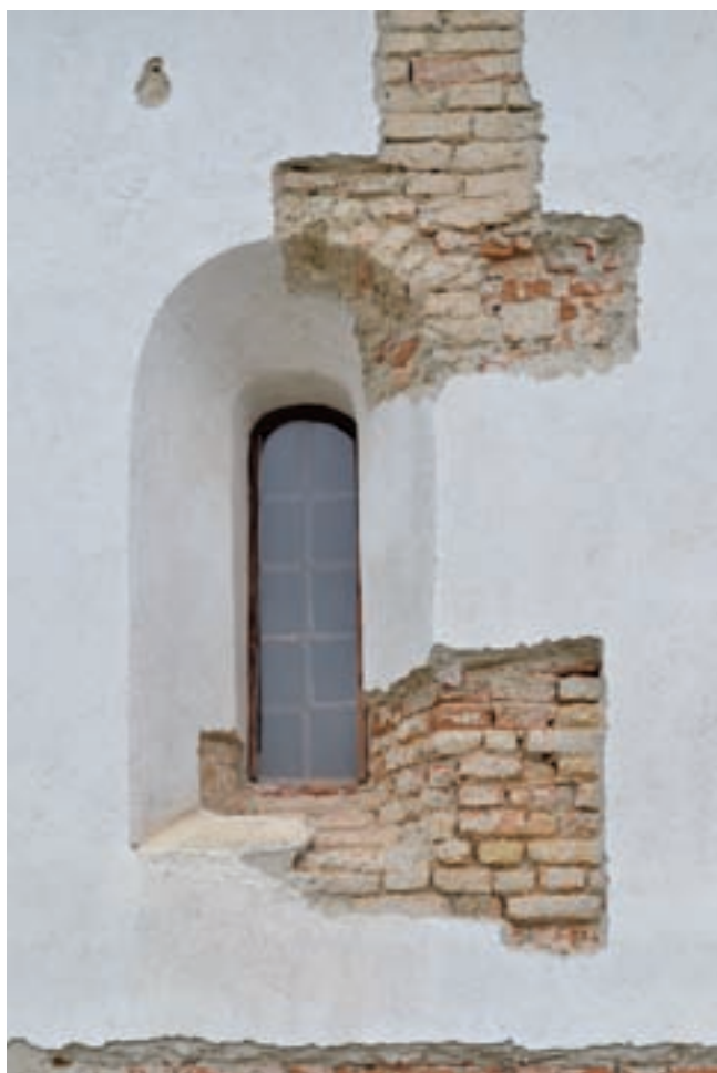
3. A hajó délkeleti ablaknyílása kutatás közben

Székely ( villa Zekul ) falu első okleveles említése 1284 körüli, egy itt elkövetett hatalmaskodás révén. 4 Neve székely népnév, az egykori gyeptűvédő őrség lakóhelye emléket őrzi, eredete feltehetően X. századi. 5 1316-ban a falu a Hontpázmány nembeli Bánki Lökös unokáinak birtoka, akik ebben az időpontban (többek között) hitbér, hozomány, valamint leánynegyed fejében e birtok felét átadják a Jákó nembeli Csépánnak. 6 1324-ben már a Balogsemjén nembeli Kállóiak kezén találjuk Székely egy részét. Ebben az oklevélben említik meg először templomát. Az oklevél szerint a Kállóiak hitbér és hozomány fejében a falu felét és a Szent Mihály tiszteletére épült egyház kegyuraságának ugyancsak felét szerezték meg. 7 1327-ben és 1331-ben pedig már a magát már Székelyinek nevező Csépán fiai és a Balogsemjén nembeli Nagysejéni