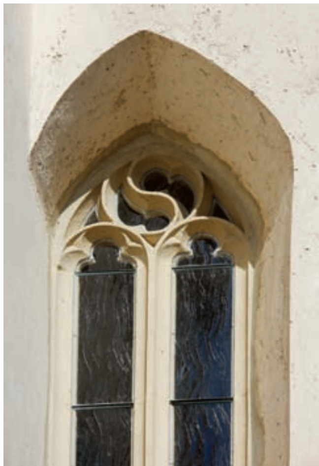
3. Mérműves ablak a hajó déli falán, a toronytól keletre

alsó zónájának építése közt némi idő eltelt. A 2006. évi régészeti feltárás során megtaláltuk az első gótikus periódushoz tartozó oltár, valamint a református időszakban visszabontott és levésett diadalívpillérek alapozását. A szentély középtengelyében az oltár alapozásához igazodó, kelet-nyugati irányú, kirabolt koporsós temetkezé-