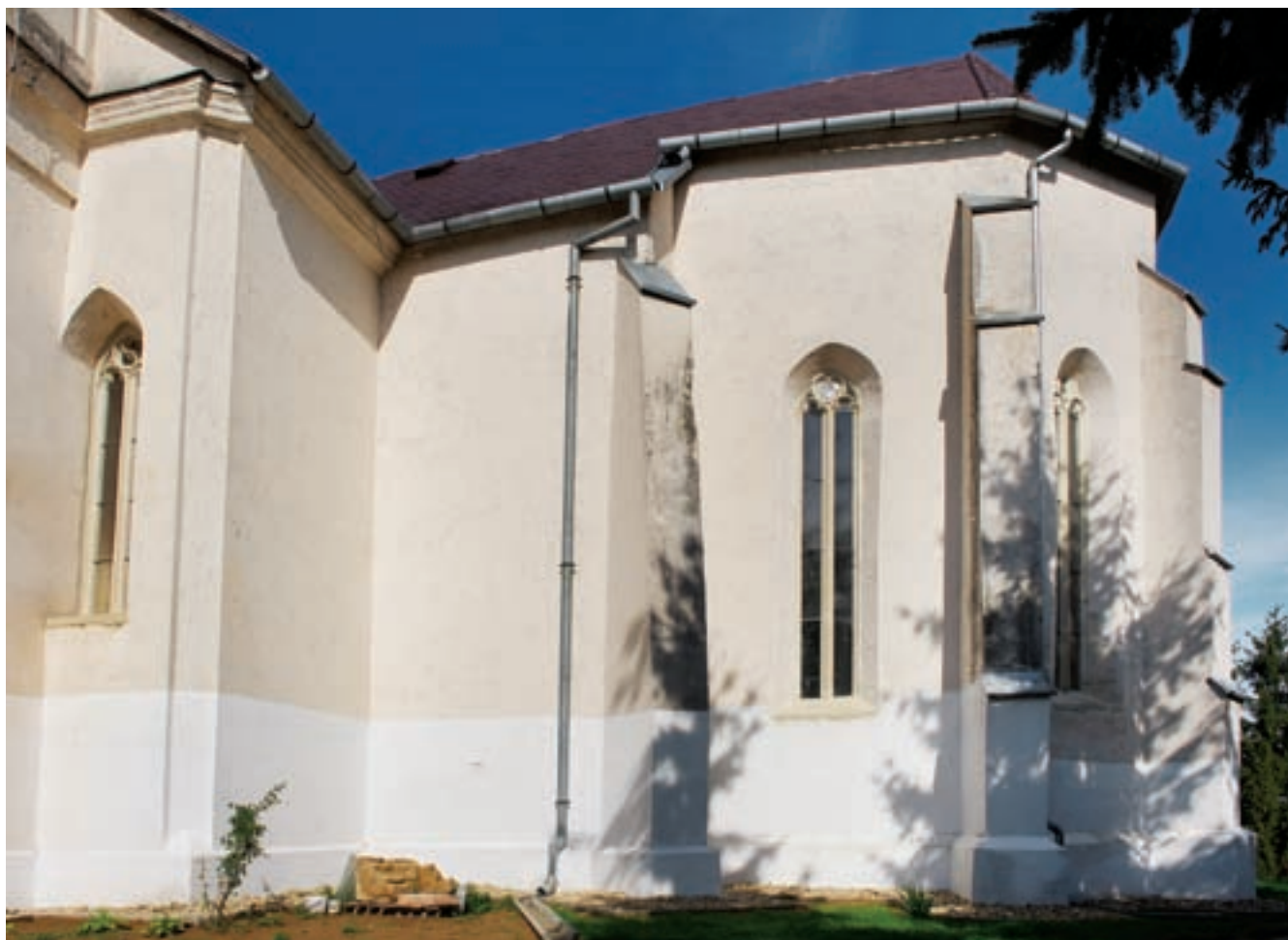
2. A szentély és a hajó részlete délről

Az első gótikus építési periódusban már kialakult a templom mai, téglalap alaprajzú, síkmennyezetes hajóból és sokszögzáródású, boltozott szentélyből álló alaprajza. E periódust a szentélyablakok mérművei és a déli hajófal nyugati végében talált mérműves karzatablak formái alapján a XIV. század végére, a XV. század elejére datálhatjuk. A szentélyben a 2006. évi restaurátori feltárás és falkutatás során előkerültek az egykori téglaboltozat homlokívei, boltvállának indításai és a hozzá tartozó meszelés (4. kép). Egyes jelek arra utalnak, hogy a korai hajó és a szentély