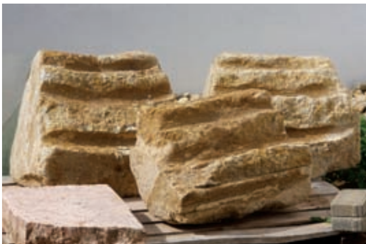
11. A kapuzat maradványai