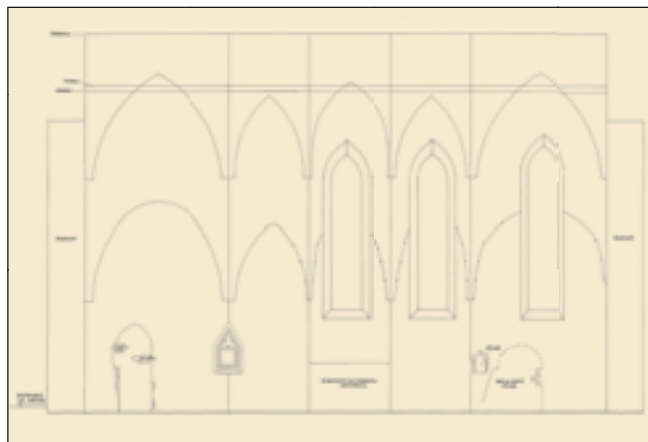
4. A szentély hosszmetsete

alsó zónájának építése közt némi idő eltelt. A 2006. évi régészeti feltárás során megtaláltuk az első gótikus periódushoz tartozó oltár, valamint a református időszakban visszabontott és levésett diadalívpillérek alapozását. A szentély középtengelyében az oltár alapozásához igazodó, kelet-nyugati irányú, kirabolt koporsós temetkezé-