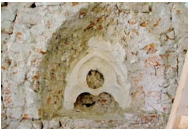
6. A hajó déli falának nyugati ablaka feltárás után

A XIV. század végi, XV. század eleji templomhajó egykori – a mainál alacsonyabb – falkoronáját a belsőben végzett falkutatás során megtalált vízszintes elválással azonosíthattuk az északi és a déli hajófalán. A korábbi