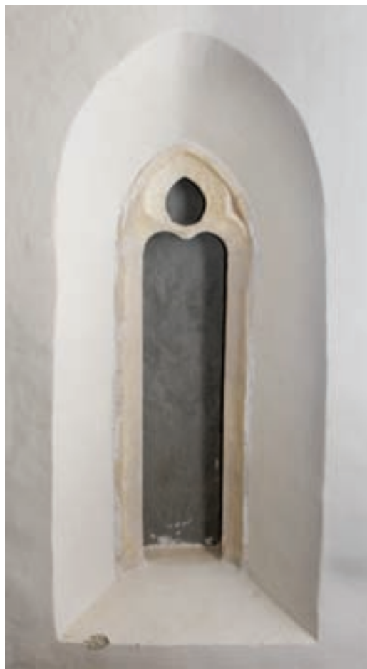
7. A hajó déli falának nyugati ablaka helyreállítás után

A XV. század végén, a XVI. század elején jelentősen átalakították a templomot. Megemelték a szentély falkoronáját, elbontották a korábbi ablakok záradékát, és a kőrestaurátori megfigyelések szerint a régi merműveket 250 cm-rel magasabban újra összerakták. Ugyanakkor a magasztáshoz szükséges szárköveket a korábbitól eltérő kőanyagból gyártották le. Az új szentély szintén boltozott volt, rend-