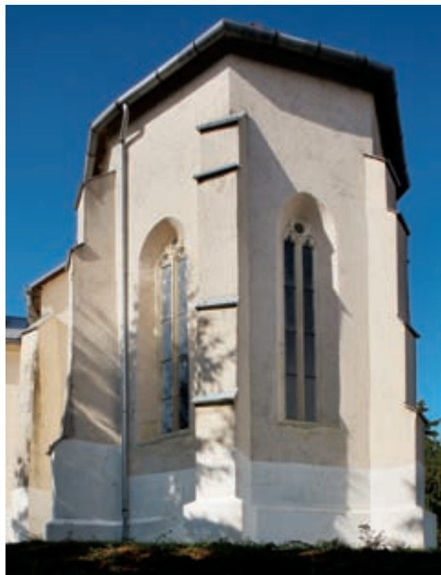
1. Összkép a szentély felől

zott. 6 A capella megnevezés vonatkozhatott az épület egyházi helyzetére, vagy utalhatott annak kis méretére, esetleg építőanyagára is, de mindenképpen akkor fennálló épületet jelölt, amelynek helyét a kutatók 1872 óta szinte teljes egyetértésben a szentmártoni templomdombon feltételezik. 7 Zsurk birtok ugyanis, amelyet 1212-ben Bánk bihari ispán vásárolt meg Ipochn bicsi ispántól, s ekkor határait megjárták, még ekkor is – több mai falu határát magába foglaló – nagy területet ölelt fel. Szentmárton keleti felét ekkor Aba nembeli Artolph birtokaként említették. 8 Írott adatok híján csak feltételezhetjük, hogy Bánknak elkobzott birtokait II. Endre király adományozhatta Tomaj nembeli Dénes főlovászmesternek. 1322-ben már bizonyosan az ő leszármazot-