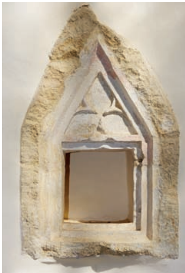
5. A szentségtartó fülke

sek kerültek elő, a rablás során visszadobált, hatágú csillagos díszítésű, kerek rézveretekkel, melyek középkori temetőinkben a XIV. század elejétől végéig ismeretesek. 12