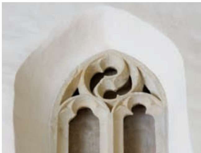
8. A hajó déli falának keleti ablaka helyreállítás után

Losonczy Istvánt, a temesvári hőst, a helyi hagyomány szerint az itteni templomban temették el 1552-ben. Birtokait – királyi kegyként fiúsított – lányai örökölték, itteni birtokait Losonczy Anna kapta. A gazdag szépasszony három házasságáról tudunk. Báthory Miklós után Ungnad Kristóf, majd 1590-től Forgách Zsigmond felesége lett. Így kerültek a Losonczy-birtokok Forgách Zsigmond