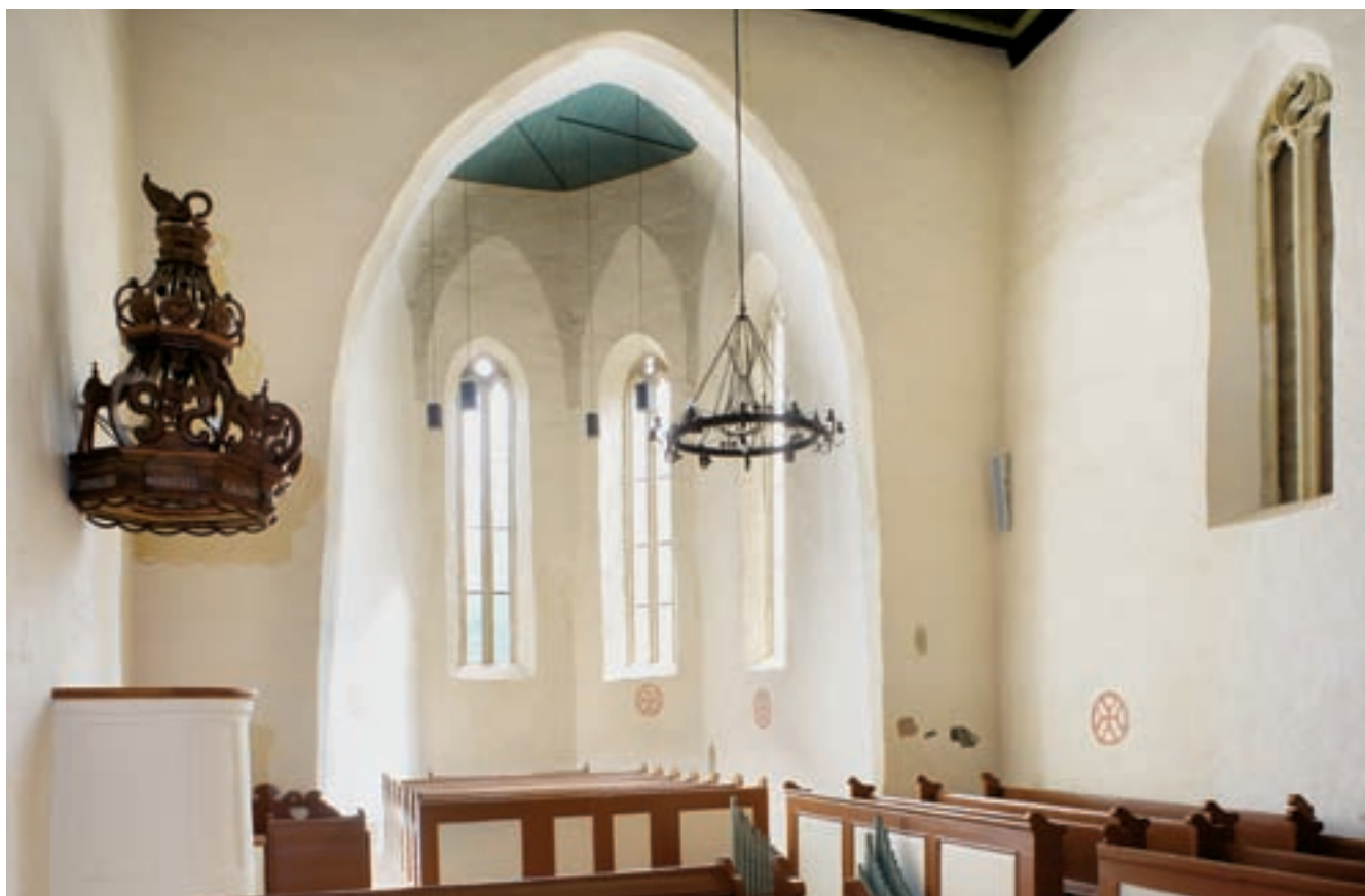
9. A helyreállított szentély nyugat felől

1809-ben a templom mellett ócska fatornyocska állt. 21 Egy valamivel később végzett átalakítás során visszabontották a hajó – egykor nyilván magasabb, XV. század végi – falkoronáját, és egy tetőgerinc alá hozták a szentélyvel. Ekkor készülhetett az 1831-es keltezésű, szerény minőségű síkmennyezet, majd felépítették a déli előcsarnokot és tornyot. 22