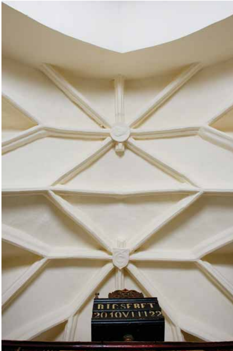
4. A szentély boltozata

A magyar királyság területén legkorábban Pozsonyban, a Luxemburgi Zsigmond által átépített vár 1430-as évekből származó keleti kaputornyának átjárójában kimutatható megoldás csak a XV. század utolsó harmadában-negyedében és a XVI. század első harmadában vált idehaza elterjedtté. 9 Ha a zárókövek egy-egy bordaindításának megszakadása eredeti megoldás, akkor a boltozat semmiképpen sem készülhetett az 1490 körüli időszaknál korábban, s amennyiben tudatos kialakítás eredménye, ugyanerre az időre mutat post quem -ként az ablakkönyöklő íves megformálása is. 10