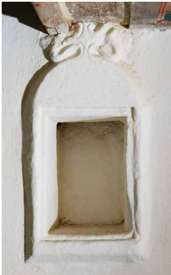
3. Szentségfülke a szentély északi falán

A szentélyt az egyik legegyszerűbb hálóboltozat-forma fedi. Az oldalaikon rézsűbe metszett homorlattal profilozott bordái a nyugati és a záradéksarkokban visszametszéssel indulnak, utóbbiakban egyetlen pontból. Az északi és a déli fal közepének boltindításainál szintén egy pontból válnak szét a bordák, előttük csücsköstalpú pajzsok jelennek meg. 5 Az északkeleti és a délkeleti sarokban a pajzsok helyett – amennyire ez a vastag meszelésréteg ellenére érzékelhető – igen egyszerűen, tagolatlan formákkal kialakított, háromszögletű emberfejek láthatók. A boltozat nyugati zárókövének kerek tárcsáján hasonló jellegű, valószínűleg Krisztus-fejet ábrázoló dombormű jelenik meg. A keleti zárókövet csücsköstalpú pajzs díszíti, rajta körre tekeredő, farkát nyaka köré csavaró, s lábával a Gutkeled nemzetség címerábrájával díszített pajzsot tartó sárkányalak domborműve látható. 6 A zárókövek egymás felé futó bordái röviddel kiindulásuk után megszakadnak. Ez eredeti középkori megoldás is lehet, de az sem teljesen kizárt, hogy a köztük lévő, a hevederív által