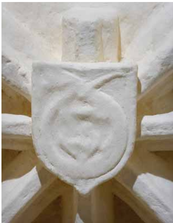
5. A szentélyboltozat keleti záróköve

A falu nagy része a XV. század harmincas éveitől a Bátori család tulajdonában volt, s még a XVI. század közepén is majdnem teljes mértékben e család birtokolta. 11 Miután a település ismert kisebb birtokosai közt – egyetlen példától eltekintve – nem tudunk a Gutkeledek sárkányfogas címerét használó családról, legalábbis