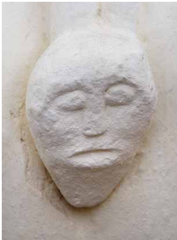
6. Konzol a szentély északkeleti sarkában

A felmérés Gilyén Sándor (1. sz.) munkája (KÖH Tervtár, ltsz.: 8198), a felvételeket Mudrák Attila (2–6. sz.) készítette.