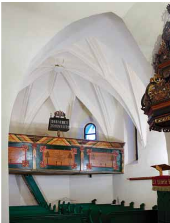
2. A szentély belseje nyugatról

nem tagolja. A szentélyen két ablak látható, a déli fal keleti szakaszán és a délkeleti falon. Kialakításuk, elhelyezkedésük és méretük teljesen egyezik a hajón láthatókkal, minden bizonnyal ezek is átalakított, középkori ablaknyílások. A délkeleti ablak bélének záradék részére vörös-sötét színű, saktábla mintázatú sávot festettek a XVI–XVII. század fordulójára körül, amely némileg emlékeztet a csengeri és a csegöldi templomon hasonló elhelyezésben, az ablakbélének záradékának külső szélén látható, eltérő színűre égetett téglából kirakott mintázatra. 4