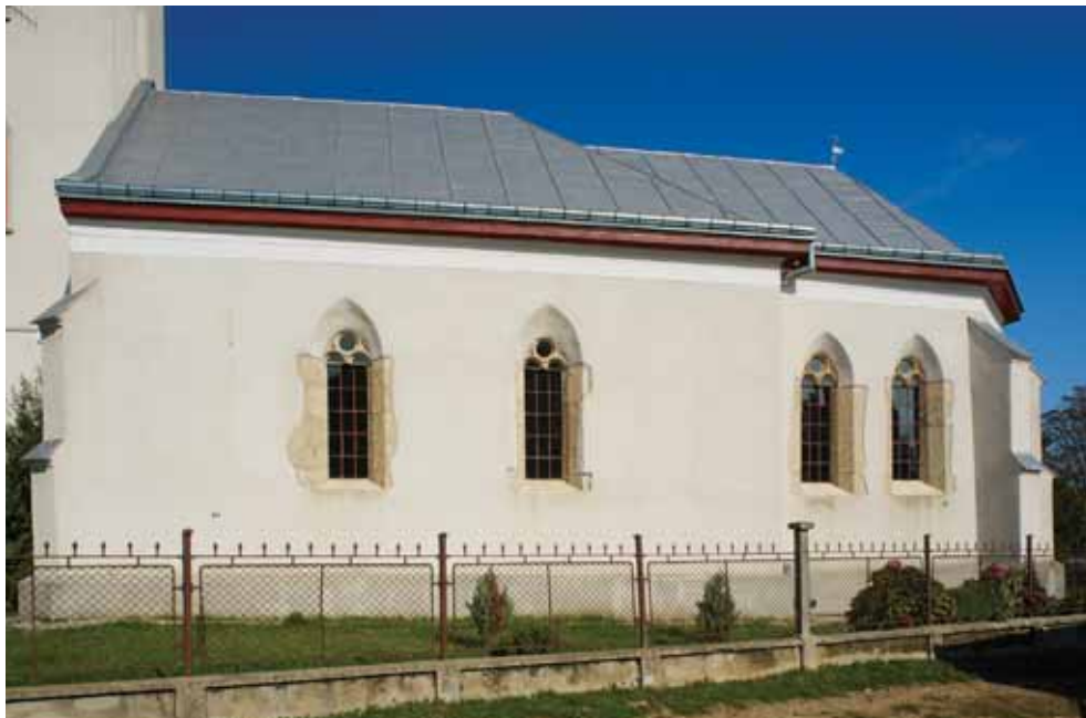
1. A templom délről

A templomon, beleértve XX. századi tornyát is – de eltekintve a szentély előbb tárgyalt északi falától és két támpilléretől –, egységes, felül rézsús felülettel lezárt lábazat fut körbe. 8 Az épület jelenlegi koronázópárkánya modern kialakítású. 9 A hajónak a középkorban valószínűleg a nyugati falán volt a bejárata, a délin ugyanis az ablakok között alig van hely ajtónyílásnak, és bejáratra utaló nyomokat Schulcz Ferenc déli homlokzatot ábrázoló rajzán sem látni. A talán csak a torony építésekor átalakított bejárat formájáról azonban semmilyen információnk sincs. A hajó déli falán két azonosan kialakított