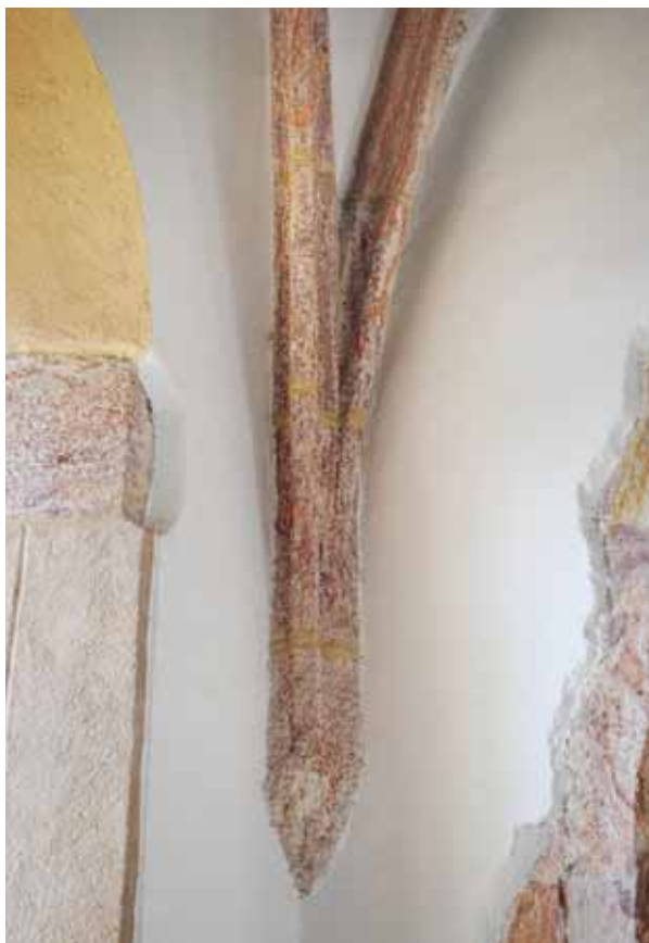
6. Boltindítás a szentély délnyugati sarkában

A fényképek Mudrák Attila (1, 3–5.) és Papp Szilárd (6.) munkái, a rajz órszí helye: KÖH Tervtár, ltsz.: K 13459.