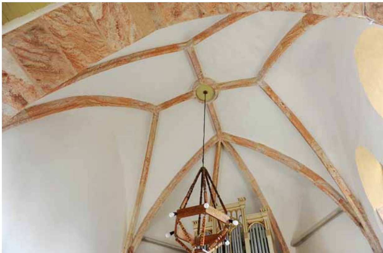
5. A szentély boltozata

és elhelyezkedő, csúcsíves, rézsús bélletű, kétosztatú ablak látható. Az ablakok osztói nem maradtak fenn, de megegyező formájú mérművük fennmaradt: kettős nyílásuk felül egy-egy orrtag nélküli félkörívvel záródik, ezek felett középen ugyancsak orrtag nélküli, egyszerű kör látható. 10 A hajó északi falát nem bontja meg semmilyen részlet. A szentély déli falán a hajóéval mindenben, még fennmaradásuk mértékében is megegyező két ablak látható, többi falszakaszán azonban nem jelennek meg középkori nyílások.