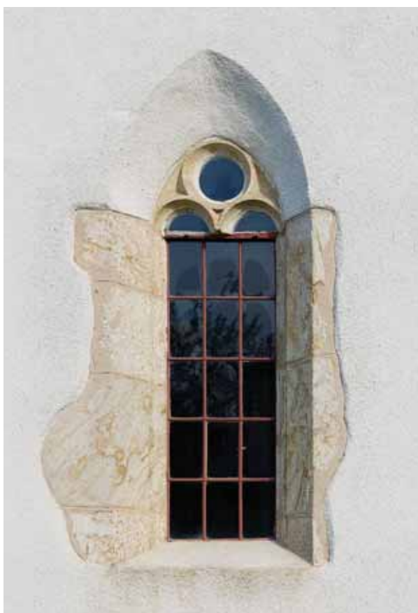
3. A hajó nyugati ablaka