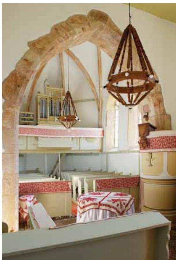
4. A szentély belseje nyugat felől