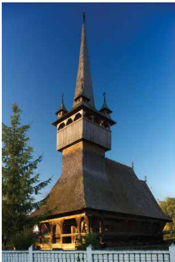
1. A Szent Mihály és Gábor arkangyalok fatemplom délnyugatról

Az erdélyi Bükk-hegység Erdély felé eső oldalán, a történeti Szatmár és Közép-Szolnok (később Szilágy) vármegye határán fekszik a közigazgatásilag egykor az utóbbi vármegyéhez tartozó Szilágykorond község. A középkorban és a kora újkorban különböző előnevekkel (Kis-, Nagy-, Oláh-, Tóth-, Felső-) szerepelnek Korond településnevek a környékre vonatkozó történeti forrásokban. Valószínűleg több egymáshoz közel fekvő, szomszédos faluról van szó, amelyeket előnevekkel különböztettek meg egymástól. A forrásszövegekben szereplő települé-