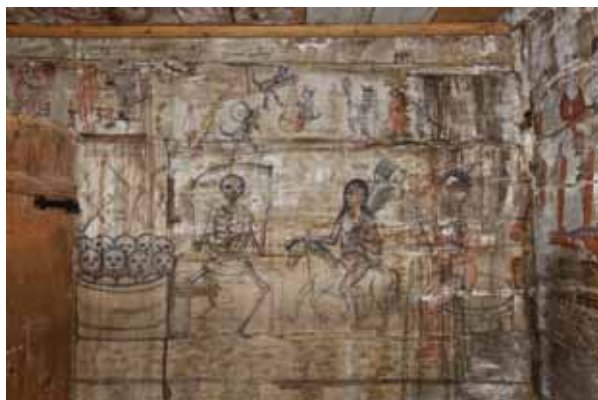
6. A Halál, A Pestis és a Lustaság allegóriája, az Utolsó ítélet részlete a női templomának nyugati falán

A hajó oldalfalait huszonegy-huszonegy álló vértanú alakja borítja, akik háromnegyed profilban, meglehetősen sematikus módon, egyforma vonásokkal és öltözetben, kezükben keresztet tartva vonulnak a szentély felé, csak felirataik alapján lehet megkülönböztetni őket. A hajó nyugati végén az egykori festett dekorációból csak a bejárat és a betekintő nyílások fölött látható, egyelőre tisztázatlan szimbolikus tartalommal bíró, halakat ábrázoló sor maradt meg. A nyugati fal többi díszítése a később beépített karzat miatt valószínűleg elpusztult. A környékbeli fatemplomok képi programját alapul véve feltételezhető, hogy a nyugati falon a Teremtéstörténet jelenetei szerepeltek. A mennyezetben az egyes sávokat változatos növényi, illetve geometrikus elemekből komponált díszítő sorok választják el.