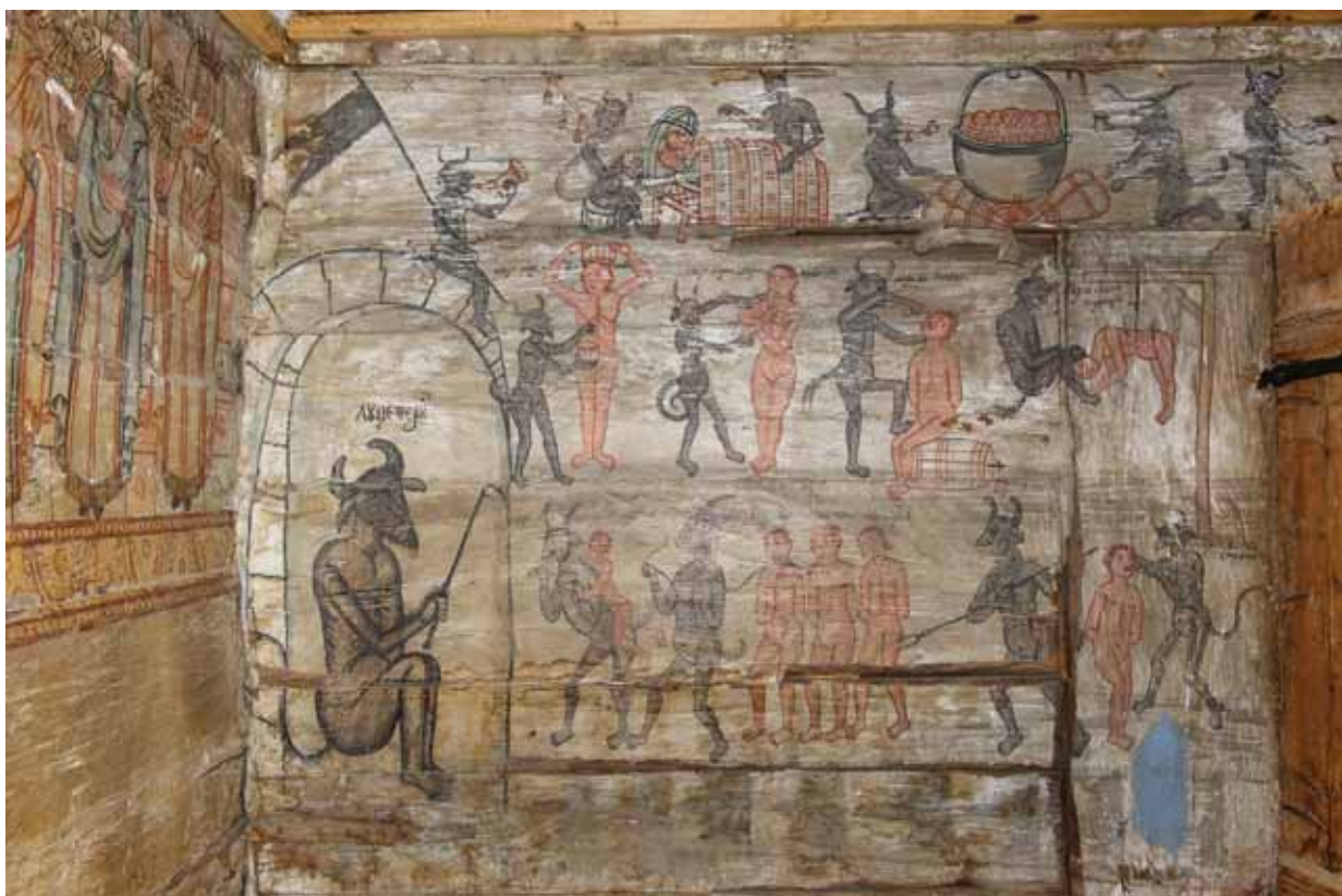
5. Lucifer fogadja a kárhozottakat, az Utolsó ítélet részlete a nők templomának nyugati falán

helyet kapott még Szent Mihály arkangyal is – szintén mandorlában –, akit katonaként, kezében kardot, illetve kelyhet tartva ábrázoltak. A középső sáv két oldalán hét-hét térdelő, kezükben csukott könyvet tartó próféta látható, akiket a szentély falain sorakozó főpapok már említett ábrázolásai körül alkalmazott, árkádives keretezés választ el egymástól. A hajó nyugati végére eső három-három próféta képe rendkívül töredékes, a festésréteget a később beépített karzat használata idején bekarcolásokkal roncsolták. A próféták egyébként az ikonosztázion legfelső sorát szokták alkotni, itt valószínűleg helyhiány miatt kerültek át a mennyezetre. A próféták alatt Jézus szenvedéstörténetének egyes epizódjait ábrázolták, összesen tizennégy jelenetben. A történet a déli oldal keleti végén az Utolsó vacsora jelenetével kezdődik, és szemben, a Sírbatétellel végződik. A szenvedéstörténet nyugati részre eső jelenetei nagyrészt elpusztultak, csak felső részeikből maradtak töredékek. Az Atya és a Szentháromság történet kompozíciói alapján feltételezhető, hogy a mesterek nyugati előképeket, valószínűleg metszeteket is használtak munkájuk során. A szenvedéstörténetben a katonák viselete a korabeli katonai egyenruhákra emlékeztet.