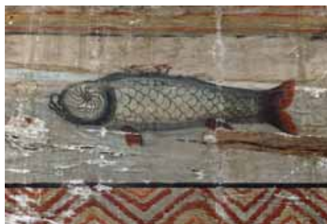
4. Hal a férfiak templomának nyugati falán

Az ikonosztázionon az alapképsort lezáró párkányként, valamint az ajtók ívei körül megjelenik a külsőt is díszítő, faragott kötélmotívum. A képfalon a második, vagyis ünnepsor kereteit aranyra és vörösre festették, a felső elemre fehérrel, cirill betűs román feliratokban az ünnepek nevét is fölírták. Balról jobbra haladva a következő hat ünnepet helyezték el: Szűz Mária születése, Szűz Mária bevezetése a templomba, Örömhírvétel (Angyali üdvözlés), Jézus bemutatása a templomban, Királyok imádása, Jézus körülmetélése. A Királyi Kapu fölött, az