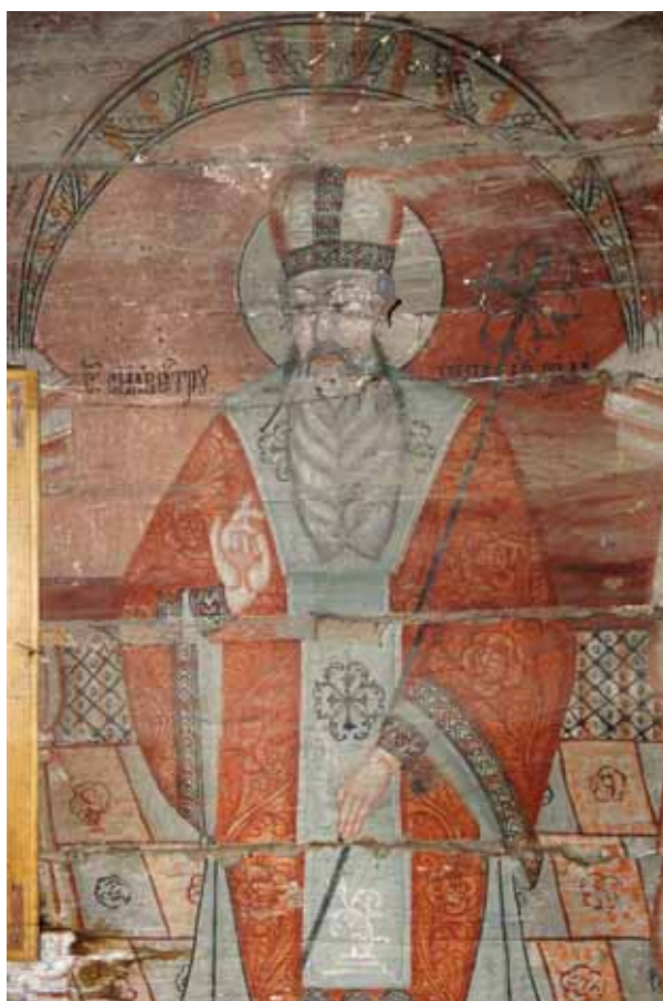
3. Szent Szilveszter római pápa képe a szentély déli falán

anyagára utaló szőlő és búzakalász. A szentély keleti falán, a kis ablak két oldalán Nagy Szent Bazil püspök, illetve Szent István diakónus, első vértanú ikonja szerepel, míg a délkeleti falszakaszon Aranyszájú Szent János, illetve Nazianzoszi Szent Gergely egyházatyák állnak. Az utóbbi három főpap közül Nagy Szent Bazilnak és Aranyszájú Szent Jánosnak tulajdonítja a hagyomány azt a két liturgiát, amelyet mai napig a legtöbbször végeznek a bizánci egyházban. A déli falon Dallamszerző Szent Rómán (Romanosz Melodosz) diakónus és Szent Szilveszter pápa kapott helyet, az utóbbi a kisebb templomok képi programjában ritkán szokott szerepelni. A bizánci templomok szentélyében a szent főpapok már a IX. századtól kezdve, a földivel „párhuzamosan” folyó Mennyei Liturgia kitüntetett képviselőiként jelennek meg.