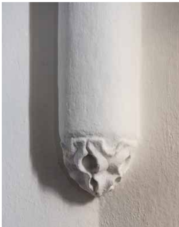
7. Konzol a szentélyben

sabban annak maradványai a föld alatt valószínűleg még megtalálhatók. A jelenlegi épületrész datálásához pusztán boltozata, leginkább még növényi és geometrikus díszítésű konzolai adnak némi támpontot. De ezek alapján is nehéz pontosabban meghatározni a keletkezését, mint nagyjából a XIV. század közepe és a XV. század közepe közötti száz év. 26 E tág határokat legfeljebb akkor tudjuk szűkíteni, ha a szentély építését hozzákapcsoljuk a templom egy további részének a keletkezéséhez – ami persze alig több pusztá hipotézisnél. Egyedülálló megoldás falusi templomok esetében a toronysisak domború oldalú, kupolaszerű formája. E kialakítás nem teljesen ismeretlen a gótikus építészetből. 27 Ilyen formával tervezték meg a frankfurti (am Main) dóm 1415-ben elkezdett tornyát, s építették meg 1429 körül a bécsi Maria am Gestadetemplom tornyának lezárását. 28 Utóbbi hatásaként Magyarországon is számon tart a kutatás egy hasonló sisakformát, a pozsonyi ferences templom tornyát. 29 Ha a vetési sisak egyáltalán a középkorból származik, valamilyen módon nyilván Bécs lehetett az előképe, s ezt az összefüggést figyelembe véve keletkezését leginkább a XV. század harmincas-negyvenes éveire lehet tenni. 30 A templomnak ennél későbbre datálható középkori részlete nincs.