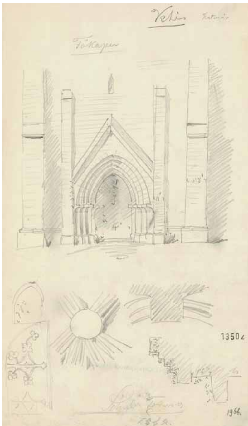
3. A templom egykori nyugati kapuja részletrajzokkal, Schulcz Ferenc felmérése, 1864

A szentélyen három ablak látható, déli falának keleti szakaszán, délkeleti-, valamint záradékfalán egy-egy. A déli ablak kerete vakolt felületű, kialakítása arányaitól eltekintve – melyek a szentély többi ablakáét követik –