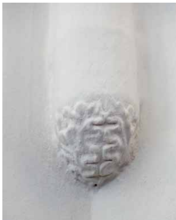
8. Konzol a szentélyben

Szirmay Antaltól származik az az ismeretlen eredetű adat, hogy a templomot Vetési Albert 1460-ban építtette, s Vetési neve azóta hagyományosan összekapcsolódik az épület történetével. 32 A veszprémi püspököt (1458–1486), aki előtte hosszabb ideig gyulafehérvári kanonok, főesperes, majd nagyprépost is volt, valóban összefüggésbe lehet hozni a templommal, több konkrét adat alapján is. 33 1433-ban, amikor Itáliában tanulva Rómába utazott, hogy részt vegyen Zsigmond király császárrá koronázásán, supplicatió ban kért búcsúengedélyt a templom számára a pápától. 34 Az ekkor körülbelül húsz éves Vetési azonban kevésbé (csak) saját elhatározásából nyújthatta be a kérelmet – noha az engedély a templom patrónusának nevezi –, mint inkább Vetésen élő rokonai kívánságára. Az ilyen jellegű kérvényeket ugyanis csak személyesen lehetett a kúriában beadni, ezért általános volt, hogy a más céllal, leginkább zarándoklat miatt Rómába utazó