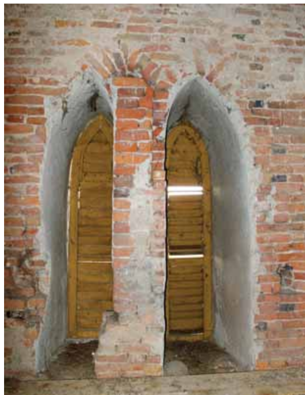
5. Átalakított ablaknyílás a torony belsejének második emeletén

a legvilágosabban. A bélletlépcsős kaputípus 1100 körül jelent meg Magyarországon, és hosszú, a XIV. századba is benyúló karriert futott be. 20 Szatmárban és környékén szinte tipikusnak mondható a timpanon, oszlopok és leginkább vízszintes tagolások nélküli, háromszögű oromzattal lezárt szerkezet (ld. pl.: Csaroda, Csengersima, Gacsály, Gyügye, Levelek, Székely, Zajta). 21 Ezeket az emlékeket a XIII. század második és a XIV. század első felére szokás datálni – újabban leginkább a XIV. század elejére 22 –, melyen belül a vetési kapu bizonyosan egy késői típushoz tartozik. Csúcsíves archivoltja, a lábazati- és fejeztopárkány jelenléte, valamint a kaput közrefogó lizénák már mind a gótikus építészet felé mutató megoldások, melyek a vetési szerkezetet szinte a fiatornyok által keretezett, gazdagon tagolt bélletű, XIV. századi gótikus kaputípussal teszik összevethetővé. 23 A hozzá bizonyos szempontból legközelebb álló emlék nem Szatmárból, hanem Segesvárról ismert, ahol a domonkosok templomának nyugati kapuján a keretező pillérek tetején már fiatornyos végződés jelenik meg. 24 A bizonyosan 1300 utáni erdélyi példát szintén nem tudjuk pontosabban keltezni, de a fentiek alapján a vetési kapu a XIV. század első feléből, s annak aligha az elejéről származik. Nem lehet ezzel kapcsolatban figyelmen kívül hagyni a templomhajó mennyezetének 1794-es feliratát, amely szerint