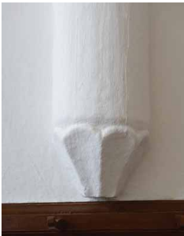
9. Konzol a szentélyben

rokonokat bízták meg az intézésével. 35 Mindenesetre a búcsúengedély kelte összecseng a XV. századi építkezésnek a részben persze csak hipotetikus idejével. Így aztán ha bizonyítani nem is lehet, még akkor is felvethető a templom átépítésének és Vetési római beadványának az összefüggése, ha búcsúengedélyek kérése amúgy nem feltétlenül csak építkezések miatt történhetett. Konkrétabb kapcsolatra utalhat Vetési és a templom átépítése között egy szintén csak feltételezéseként megfogalmazható összefüggés, amely – tekintve, hogy ezzel már a többszörös feltevések mezejére tévedtünk – óvatosan kezelendő. Vetési 1430–1431-ben a bécsi egyetemen tanult, nagyjából tehát akkor, amikor a Maria am Gestade-templom toronysisakját, amely különös alakjával a kortársak között is nagy feltűnést kelthetett, befejezték. Teljesen nem kizárt tehát, hogy e megoldás valamilyen formában a későbbi püspök közreműködésével jutott el a szatmári faluba. 36 Vetési a továbbiakban is szíven viselhetette a család központjában álló egyház sorsát. 1455-ös római útján, amikor több kiváltságot is kapott a pápától, újabb búcsút nyert a templom számára. 37