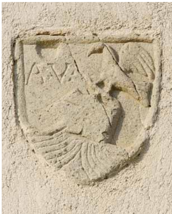
10. Címerpajzs a hajó déli homlokzatán

ható, melyek nyilvánvalóan Vetési monogramját hivatottak megjeleníteni. A pajzs nyomott arányú, háromszögű alakja összeegyeztethetőnek is tűnik Vetési személyével és a XV. századi építkezés feltételezett időpontjával. 38 A pajzsban ábrázolt sisak és sisakdísz ugyanakkor meglehetősen különös megoldás, legalábbis a kőfaragásból nem ismert, a címerpajzs nélküli sisak-sisakdísz kompozíció pedig tipikus XIV. századi forma, noha a XV. század közepéről is találunk még rá példát. 39 Az oldalról megjelenített, ágon álló madár ráadásul nem egyezik Vetési sok helyről ismert, egységes címerábrájával, a szemből ábrázolt, szárnyait széttáró madárral (karvaly). 40 A vetési faragvány feltehetően a régi családi címert mutatja, amely a Kaplony nemzetségből leszármazó egyéb családoknál is kimutatható. 41 Az ábra eltérését lehetne még azzal magyarázni, hogy veszprémi püspöksége előtt talán Vetési is ezt használta, de a címeren látható betűk egyértelműen későbbi időszakra utalnak. 42 A tulajdonos monogramjának megjelenése a címerpajzson, vagy azzal kapcsolatban a XVI. század első felétől vált valamelyest használatossá. 43 Vetési monogramja ráadásul korai humanista kapitálissal van írva, s e betűtípusnak a magyarországi elterjedésével – noha a XV. század utolsó negyedében néhány fő emléknél már kimutatható –, a XVI. század elejénél korábban, legalábbis falusi környezetben, aligha számolhatunk. 44 Mindezt leginkább talán úgy magyarázhatjuk,