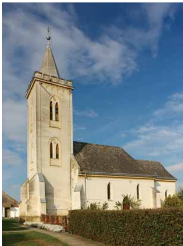
1. A templom délről

A templomon ma kőlapokból összeállított, modern lábazat, a hajón és a szentélyen újkori koronázópárkány fut körbe. Eredeti párkányprofilokat azonban némi eltéréssel Schulcz és Rómer is lerajzolt. 8 A Rómer megjegyzése alapján idomtégglából készült lábazati párkány nála alul rézsűből, felette egymáshoz képest visszaugratott két félpálcátagból áll, Schulcznál a középső tagozat élszedést mutat. 9 A főpárkány kőanyagára szintén Rómer utal, alul