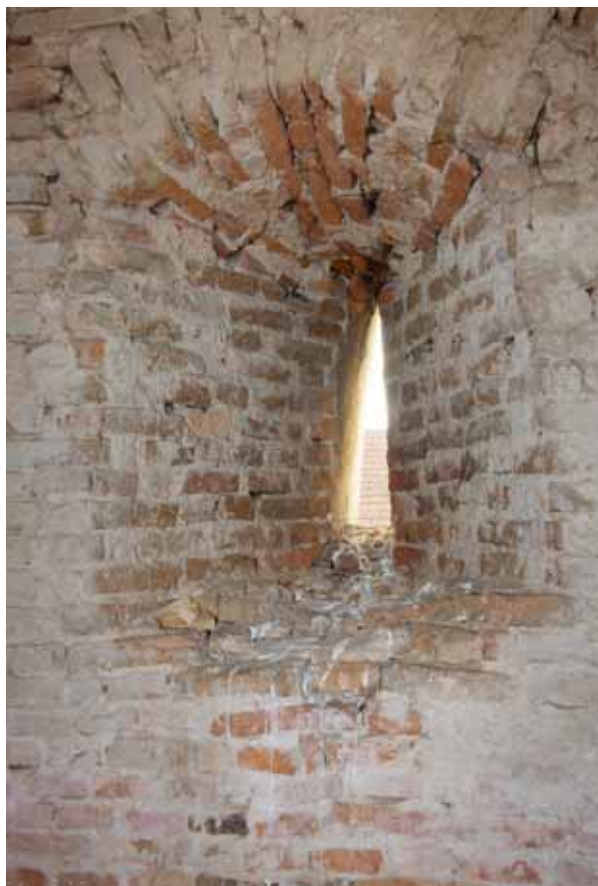
4. Ablak a torony belsejének első emeletén

megegyezik a hajón megjelenő ablakokéval. A másik két szinten csúcsíves, rézsús bélletű ablaknak kőből faragott, középkori kerete van. E két ablak egykori mérműves kialakítására a bélletük közepén felfutó mérműtagozat utal, s nyílásszélességük alapján kétszartatúak lehetnek. 17