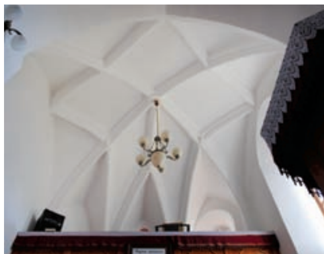
9. A szentély boltozata

kép). 16 Szamarhátíves mérműveihez a szatmári Nagygéc és Nagyszekeres templomán tűnik fel hasonló, s utóbbin olyan baldachinszerű boltindítással is találkozunk, melynek alapján az akli szentély északnyugati, töredékes „konzolja” is elképzelhető. 17 Boltozata is megjelenik a környé-