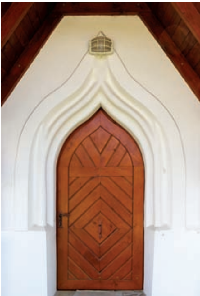
4. A hajó nyugati kapuja

homorlat, a másik oldalán egyszerű élszedés fut (8. kép). A szentély északi falán kőkeretű, élszedett profilú, szemöldökgyámos sekrestyeajtó látható, a gyámok végződésénél átmetsződő profillal (2. kép). Tőle keletre szabálytalan záradékú, számárhátíves fülke jelenik meg, profil helyett tokhoronyra emlékeztető kerettagolással. A déli oldal ke-