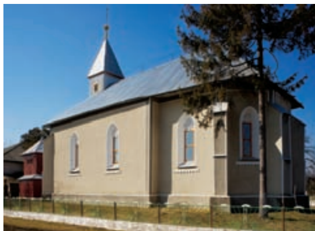
12. Csepe, a református templom délkeletről

Akli 1474-ben említett, korábban Halmi alá tartozó leányegyháza a fentiek értelmében még nem lehetett azonos a jelenlegi épülettel. Annak felépítését, miután a falu legkésőbb 1471-től teljesen a Magyi család kezében volt, és úgy tűnik, legalább a XVI. század közepéig folyamatosan ők bírták az egész települést, leginkább e család tagja-