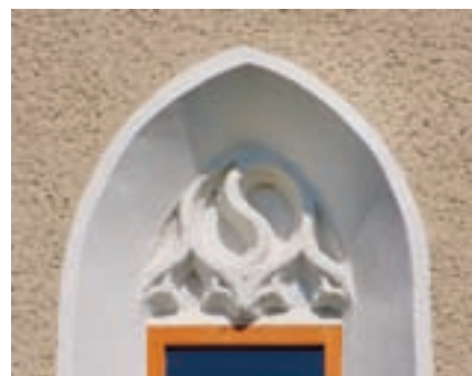
13. Csepe, református templom. Ablakméművek