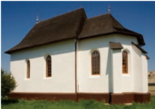
1. A templom délkeletről

rézsűs profillal kialakított, pillanatnyilag barnára festett és minden bizonnyal modern kori lábazat veszi körbe – csak a sekrestyén nem jelenik meg –, melynek eredete visszanyúlhat a középkorig. 4 Az épület falkoronáját jelenleg nem zárja párkány. 5 A hajó sarkait kívül nem támasztják támpillérek, a szentélyen viszont egyoszthatú, vastkos, részletmegoldás nélküli, zsindegyel fedett támok láthatók.