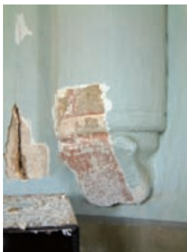
11. Konzol a szentély záradékfalának déli sarkában, kutatás közben

ken, a Beregszász melletti Nagymuzsaly (Мужиєве) templomának hajójában. 18 Miután e boltozat formája meglehetősen ritka, a két szerkezet építése közt valamiféle kapcsolat bizonyosan volt. Nem feltétlenül szoros időbeli egyezésre és közvetlen összefüggésre kell azonban gon-