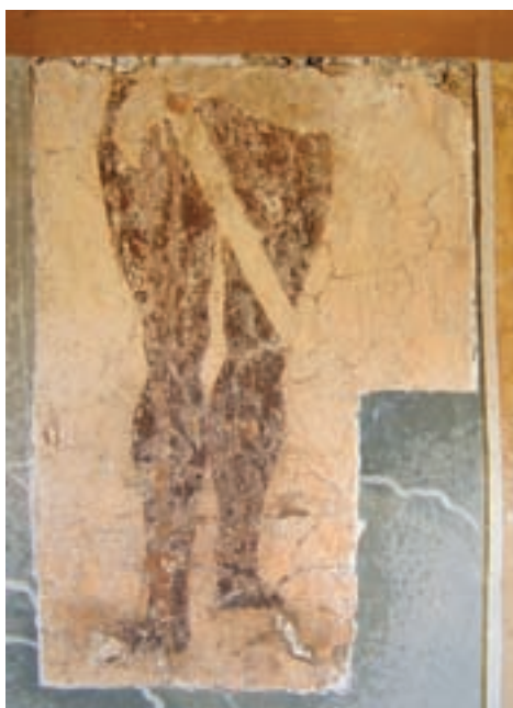
7. Falkép részlete a hajó északi falán

Noha falkutatás nélkül nem lehetünk benne biztosak, a ma látható megoldások és részletformák alapján a jelenlegi templom egységes építkezés eredményének tűnik. Ennek ideje a részletek alapján nagyjából meghatározható. A nyugati kapu és a sekrestye tipikus tagozatátmetsződései és -szétválásai együttesen, bizonyos előzmények után, az 1480-as évektől kezdtek Magyarországon az általános építészeti formakincshez tartozni, s a gótika végéig alkalmazták őket. 12 A (kettőstalpú) tornapajzs a XV. század utolsó harmadától volt kedvelt forma, de az északi hullámvonalakkal kialakított felső széle tipikus Jagelló-