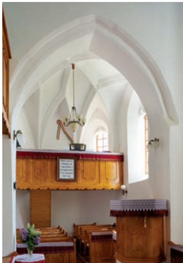
8. A szentély belseje nyugatról

E datálás illeszkedik a környék egykorú templomépítészetéhez is. Méretét, arányait és főként boltozatát illetően közel áll Aklihoz a tőle nem messze, délre fekvő, Szatmár megyei Egri református temploma, ahol a szentély csillagboltozatán szintén feltűnik a bordaáthatás. 15 Összképét illetően, de azonos nyugati kapujával és részben egyező mérműveivel szoros analógiája a két falunyira fekvő Csepe (Чена) református temploma is (12–13.