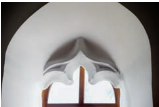
5. Mérmű a hajó déli falának nyugati ablakában

homorlat, a másik oldalán egyszerű élszedés fut (8. kép). A szentély északi falán kőkeretű, élszedett profilú, szemöldökgyámos sekrestyeajtó látható, a gyámok végződésénél átmetsződő profillal (2. kép). Tőle keletre szabálytalan záradékú, számárhátíves fülke jelenik meg, profil helyett tokhoronyra emlékeztető kerettagolással. A déli oldal ke-