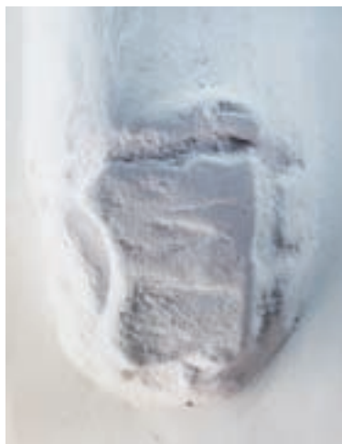
10. Konzol a szentély záradékfalának déli sarkában