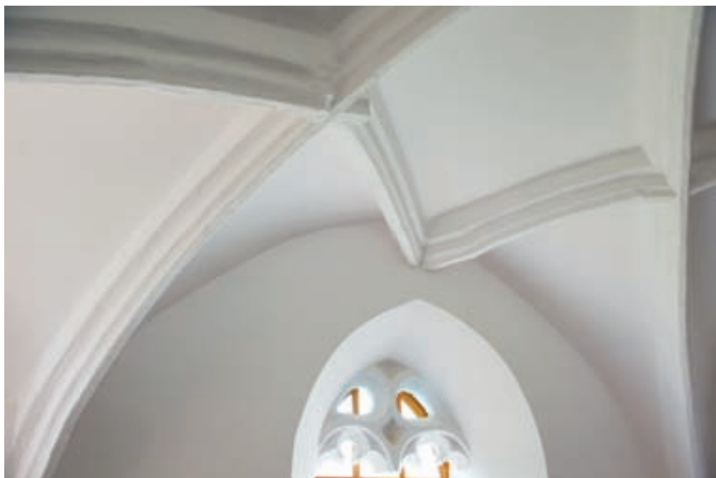
14. Akli, református templom. A szentély boltozatának és egyik ablakának részlete