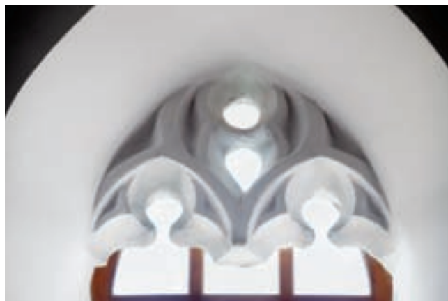
6. Mérmű a hajó déli falának keleti ablakában

A szentélyt hálóboltozat fedi, amelynek alapvázát két, egymásra majdnem merőleges keresztborda alkotja (3, 9. kép). Ezt egészíti ki az északi, nyugati és déli fal ívmezejének záradékából V alakban hozzájuk futó két-két borda, továbbá keleten, a záradékokban szokásos, Y alakban ívelő bordaszakaszok. A bordák profilja kétszer hornyolt. A boltindítások alját eltérően kialakított konzolok alkotják, melyekről hengeres faloszlopok indulnak felfelé. Nem sokkal a konzolok felett ezek felületéről válnak ki a bordák, részben visszametszett orrtaggal. A délnyugati, délkeleti és a záradék déli sarkában a bordák orrtagja azonban már a konzolok felületéről indul. A délnyugati sarokban profilozott tölcserkonzol látható, az északnyugatiban konzol helyett sátoztetőszerű forma figyelhető meg, melyen már szintén megjelenik az innen induló borda orrtagja (3. kép). A záradék két nyugati sarkában kettőstalpú tornapajzs díszíti a konzolokat. Az északnak a felületén, melynek felső szélét szembefordított, kettős hullámvonallal alakították ki, nem látható címer, a délién nehezen kivehető, talán oldalékes ábra domborodik, amely még leginkább a Gutkeled nemzetség címerét juttatja az eszünkbe (10. kép). 8 A záradékfal északi sarkában a konzol helyén már csak alaktalan tömb látható, a délit egykor feltehetően emberfő díszítette, hajának részlete az egyik oldalon még kivehető. 9 A boltozat hengeres zárókövén a bordaprofil nem fordul körbe, alsó felülete jelenleg