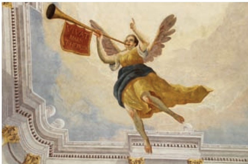
1. Kürtöt fújó angyal. Mennyezeti falkép részlete a püspöki székház konzisztórium termében

A jelenlegi püspöki palota és székesegyház épülete az 1640–1646 közötti évekből származik, építésükhöz a fedezetet és a földterületet Ung vármegye ispánja, gróf Drugeth János adta. 2 Az építkezéssel kapcsolatban számos nyitott kérdés maradt, így a falfestmény legkorábbi rétegének XVII. századi datálása nem oly egyszerű. A következő átépítés a kutatók szerint az 1740-es években