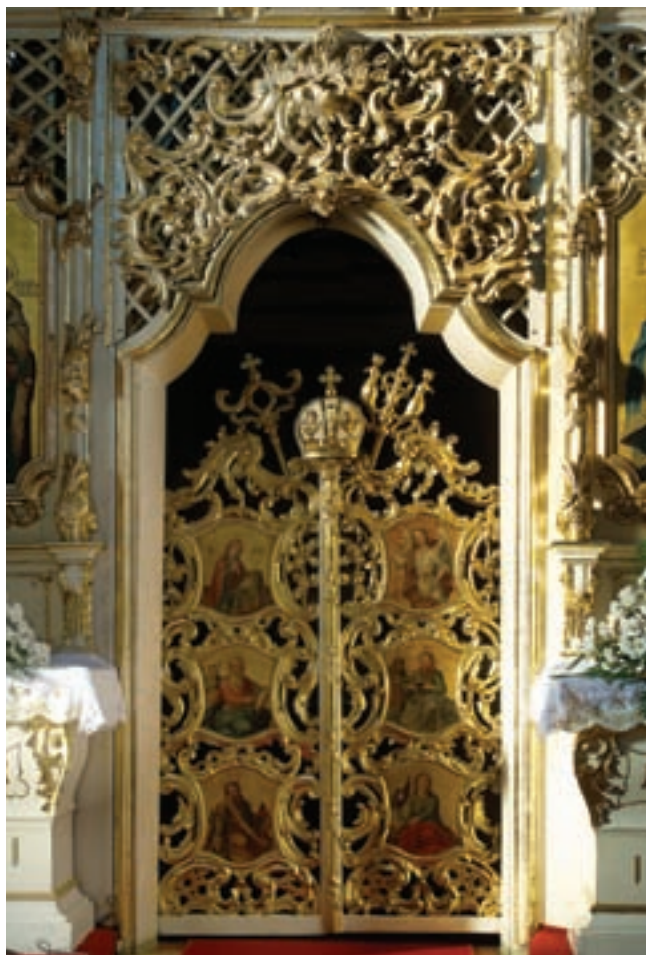
4. Az ikonosztázion királyi ajtaja

umfolyosók húzódnak. A hajót és a szentélyt fiókos dongaboltozat fedi. A templom eredeti belső elrendezését és a főhomlokzat eredeti kialakítását az 1774-ben készített felmérési rajzok őrizték meg 14 (1–2. kép). A hajó egyszerű kialakítású, kevés tagozattal variált főhomlokzatán egy kőkeretes kapu és három nagy ablak nyílt. Az órával ellátott tornyokat tört profilú, gazdagon megformált sisakok fedték, a szentély felett hagymasisakos huszártorony emelkedett.