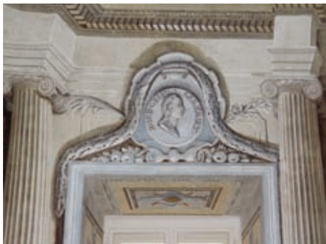
2. II. József portréja. Falkép részlete a püspöki székház konzisztórium termében

történhetett. Ez arra is utalhat, hogy a legkorábbi falképek a XVIII. század közepére tehetők.