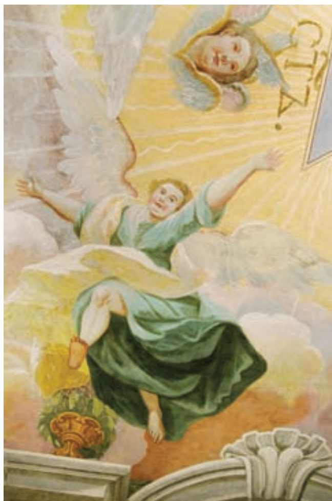
3. Angyalok. Mennyezeti falkép részlete a székesegyház szentélyében

lád ábrázolásai nem utólagosak, hanem az eredeti kompozícióhoz tartoznak. A császári személyek domborművet idéző portréi az ablakok felett találhatóak. A központi ablaknyílás felett Mária Terézia császárné arcképe látható, tőle balra fia, II. József, jobbra férje, I. Ferenc István (2. kép). A falképeket a medalionok alapján a XVIII. század közepénél korábbra nem datálhatjuk, figyelembe véve azt is, hogy Mária Terézia csak 1740. október 20-án lépett trónra. Az 1745-ben a Szent Római Birodalom császárává választott és 1765-ben elhunyt I. Ferenc István lotaringiai herceg ábrázolása 7 utalhatna az 1760-as évekre is. II. Józsefet viszont 1765-ben nevezték ki társuralkodóvá Mária Terézia mellé, és ungvári ábrázolásán a festett díszes kezdőbetűk (ahogy ez az akkori pénzérmékre is jellemző volt) úgy tisztelik, mint teljes jogú uralkodót. A medalionon olvasható felirat: IOS.(EPHUS) II D.(EI) G.(RATIA) R.(OMANORUM) I.(MPERATOR) S(EMPER) A(UGUSTUS) GER(MANIAE). IER(USOLIMAE). REX – szabad fordításban: „II. József Isten kegyelméből örökös Római császár, Németország és Jeruzsálem királya”. A falképek keletkezésének idejét így 1765-től korábbra semmiképpen sem tehetjük. Viszont az