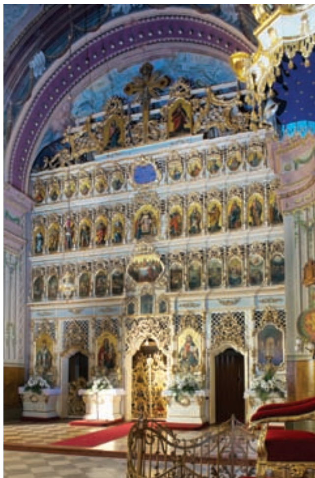
3. A székesegyház ikonosztázionja

épület is: nyújtott szentélye egyenes záródású, két oldalán sekrestyékkel, felettük oratóriumokkal; a hajó hosszanti oldalain három-három oldalkápolna nyílik. A hajó végében, a két torony között orgonakarzat emelkedik, az oldalkápolnák felett a tornyokból megközelíthető oratóri-