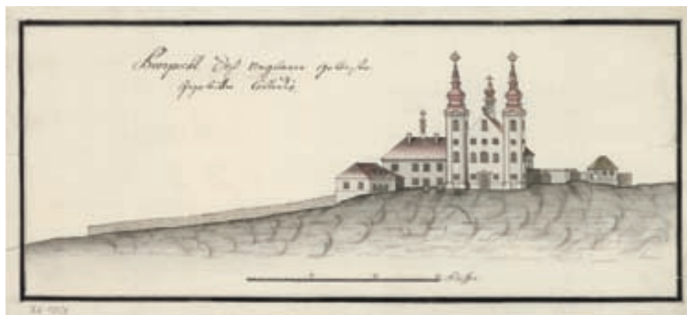
2. A jezsuita templom és kolostor főhomlokzata (1774)

parancsára a városbíró és az esküdtek annak az öt háznak értébecslését elvégezték 1636-ban, ahová a földesúr a kollégium épületeit szánta. 3 Három év múlva még egy házat fölbecsültek, azok mellé, az mely házokat Collegium helyére böcsöltünk volt. 4 1641-ben egy házat megvettek 50 forintért. 5 Bár Ungvárt 1644-ben II. Rákóczi György (1621–1660) hadai megostromolták, a következő évben meghalt az alapító is, a jezsuita páterek hamarosan mégis át tudtak költözni új helyükre. A több mint egy évtizede fölbecsült házak közül végül négyért fizetett 1650-ben Jászberényi Tamás, jezsuita rektor. 6