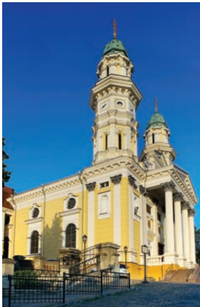
6. A székesegyház északnyugatról

A templom átalakítási munkáinak nagyobb részével 1780-ra elkészültek, a fölszentelésére október 15-én, a királynő patrónájának (Nagy Szent Teréz) ünnepén került sor. Az ekkor már súlyos beteg uralkodót gróf And-