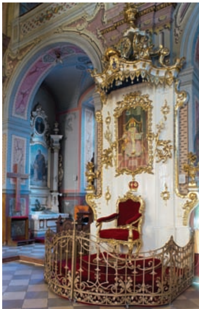
5. A püspöki trón

A jezsuita templom belsejét a bizánci rítus igényei szerint kellett átalakítani. Szent Kereszt titulusa megmaradt, de búcsúját nem május 3-án, a Szent Kereszt föltalálása ünnepén, hanem szeptember 14-én, a Kereszt felmagasztalása napján tartják, mivel a bizánci hagyomány az előző ünnepet nem ismeri. A jezsuiták idejéből származó főoltár a nagymihályi (Michalovce) plébániatemplomba ke-