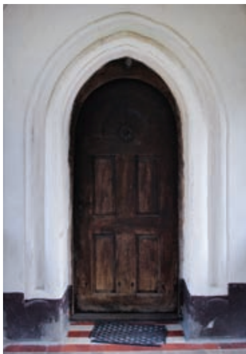
4. A hajó nyugati és északi kapuja