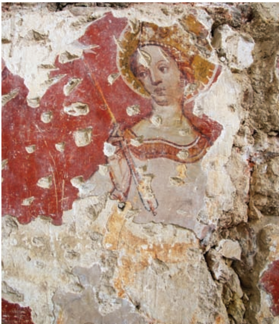
18. Torna, római katolikus templom. Szent Orsolya

zad második felének és a XV. század elejének már ismert, illetve az utóbbi évek kutatásai során feltárt nagy ciklusával. 13 A Júdás csókja kép viseletei, illetve a szentélyzáradék ablakainak réteggövein is megtalálható, első réteggként felhordott középkori vakolatok miatt a XIV. századi építkezéshez közeli keltezés tűnik elfogadhatóbbnak, de a bonyolult csoportfűzés, az arcok nemcsak félprofilban történő megjelenítése és az S alakban lágyan meghajló női szentek inkább a Zsigmond kori internacionális gótika stílusjegyeit juttatják eszünkbe. E palmaágot és attribútumokat tartó kecses figurákat a teljes feltárás után érdemes összevetni a felvidéki Torna (Turňa nad Bodvou) ma még feltárás, restaurálás alatt álló, ugyancsak egészalakos női szentjeivel. Ott a szentélyzáradék három falán kerültek ábrázolásra a finom eleganciával megfestett női szentek (18–20. kép). 14 Ma még korai lenne további kö-