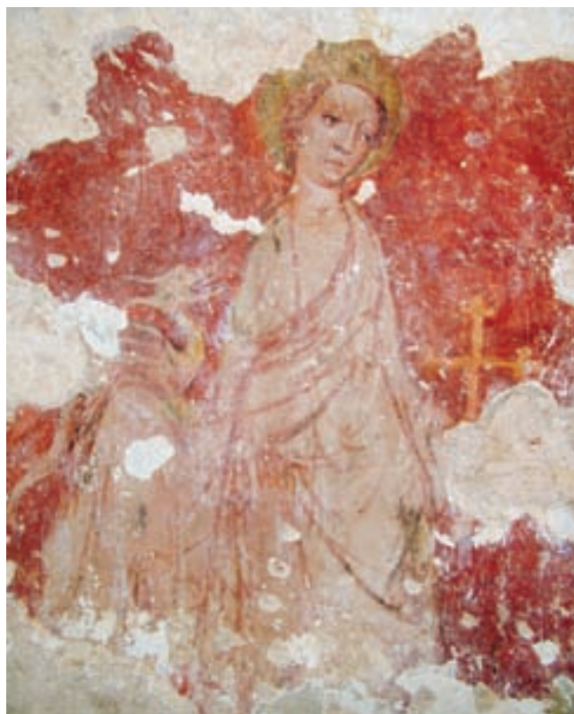
19. Torna, római katolikus templom. Antiochiai Szent Margit

vetkeztetések levonása, mivel a teljes feltárás után, nagyobb felületek együttes vizsgálatával biztosabb datálás végezhető el.