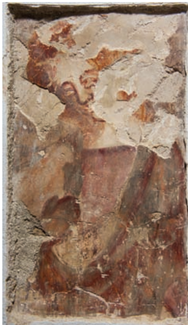
13. Női szent a szentély északkeleti falán

vatos) keret választja el egymástól. A kecses, S alakban hajló női szentek minden esetben az ablak felé tekintenek. Míg a balra néző figurák jobb kezükben a vértanúk pálmáját, baljukban pedig attribútumukat tartják, addig a jobbra nézők jobbójában látható az attribútum, baljában pedig a pálmaág. Egyelőre a vértanúság eszközeinek károsodása, részleges pusztulása miatt ma még csak két szent azonosítható. A délkeleti ablak bal oldalán, az alsó regiszterben minden bizonnyal Szent Borbálát ábrázolták, aki egy erőteljesen stilizált tornyot tart (11. kép). Ugyanezen ablak jobb oldalának felső regiszterében feltehetően Alexandriai Szent Katalin alakja ismerhető fel, aki könyvet emel maga elé. Előtte kisméretű stilizált fa ismerhető fel (1, 12. kép). E női szentek típusfigurák, egyediség megjelenítésére nem törekedett a mester. A képmezők színvilága redukált, mindössze három szint, illetve azok néhány árnyalatát alkalmazta a festő. Háttérként nem kéket, hanem feketét használt,