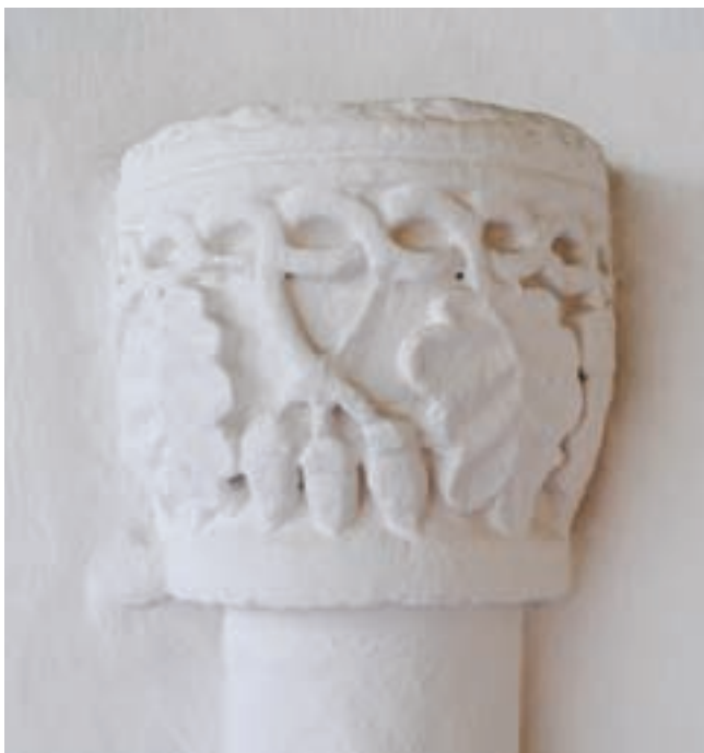
9. Oszlopfejezet a szentélyben

jelentőségéből következően itt is feltűnhettek már a korábbi évtizedekben azok a formák, melyek az ország központi részein régebb óta ismertek voltak.