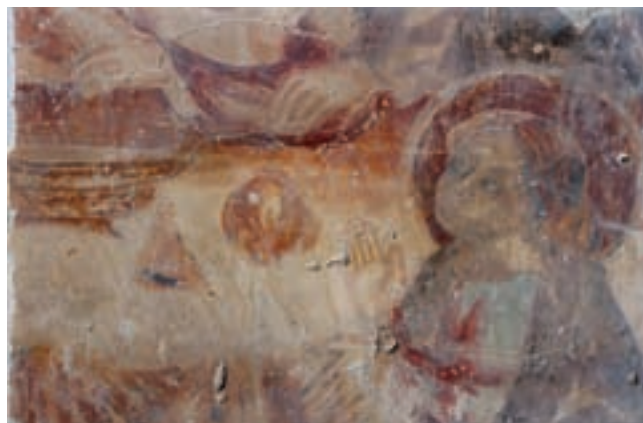
15. Az Utolsó vacsora jelenet részlete