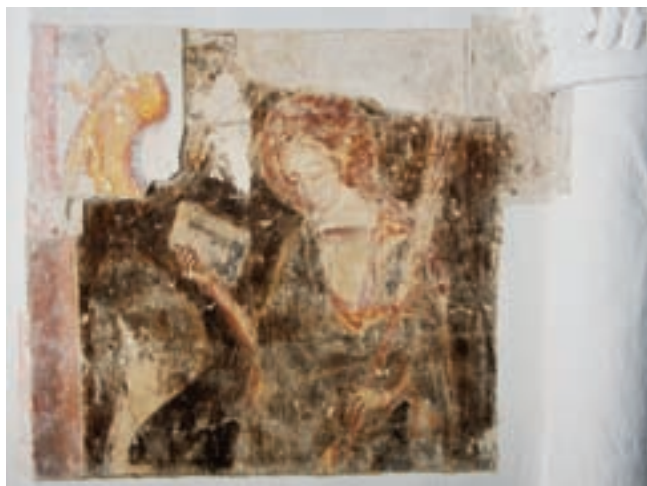
12. Szent Katalin ábrázolása a szentélyben

Elsősorban a szentélyzáradék északi falát és három nagy ablakának környezetét vizsgáltuk. Az ablakok rétegekőveire ugyan ráfut a freskót hordozó vakolatréteg, de a bétetben ezt még sehol sem tudtuk megfogni. Ez minden bizonnyal annak tudható be, hogy a falakat 1–1,5 cm vastagságban borító vakolat itt néhány milliméteres vastagságúra csökken. Talán ennek következménye, hogy a XVIII. századi utolsó tatárjárást követően évtizedekig fedetlenül álló templomban leginkább ezeken a felületeken indult pusztulásnak a középkori vakolat. 8 A sarkokban álló és védettebb faloszlopok felületén több rétegben maradt fenn kifestés. Mivel a XVIII. század végén készült, rokokó mustrákkal díszített színezés mindenütt jó megtartású, az alatta lévőket csak érzékelni tudtuk – értelmezésük csak a teljes feltárás után lehetséges. 9 Az ablakkávák és a sarkokban álló háromnegyed oszlopok közti falszakaszokon mindenütt háromnegyed életnagyságú női szentek ábrázolásait tártuk fel. E figurák méretéből következtetve a nagy ablakok mellett egymás felett legalább három szinten festhettek figurális ábrázolást. A karzat az alsó alakokat derékmagasságban vágja el. Alattuk már valószínűleg csak ornamentális festés, esetleg drapéria imitáció készülhetett. Az egymás felett elhelyezkedő nőalakokat széles, törtvonalú szalagos (fogro-