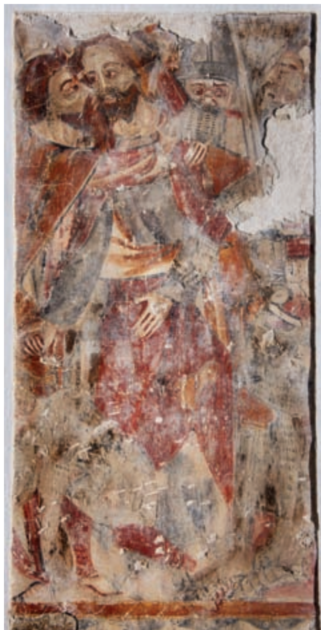
17. Júdás csókja

a képeket függőlegesen csak egy vörös és fehér színű szalagkerettel választották el egymástól. A bal oldali képen csak egy erőteljesen stilizált fa lombja és törzse látható, míg a jobb oldalin egy kisméretű, adoráló angyal, illetve egy nála lényegesen nagyobb figura áldásra emelt jobb keze tűnik fel. Itt, ha figyelembe vesszük a Passió két sorban elhelyezkedő jelenetsorának ritmusát, feltételezhető, hogy a Feltámadás jelene került megfestésre. Nagytótlak (Selo) rotundájának gótikus passiósorozatának utolsó, de már az alsó képmezőbe került három jelene között töredékesen fennmaradt Feltámadás-képén is Krisztus áldó keze mellett egy angyal jelenik meg. 10