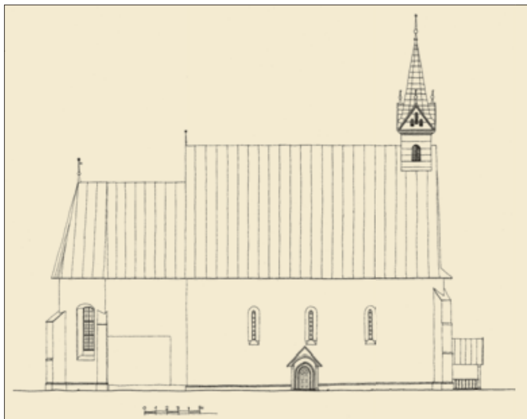
6. A templom északi homlokzatának felmérési rajza