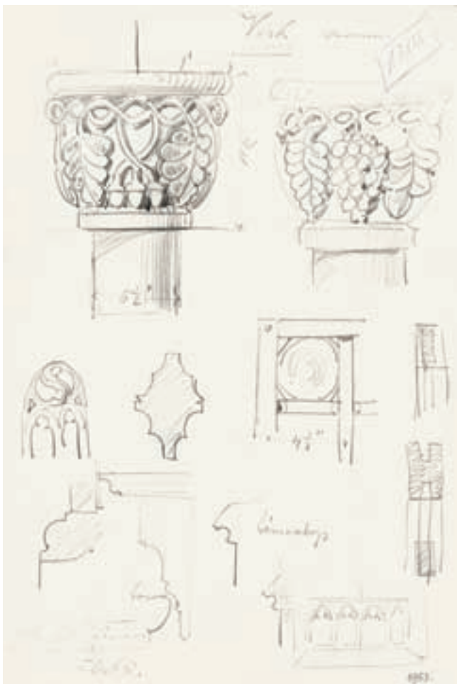
3. Schulcz Ferenc részletrajzai a templomról

másolhatja az eredetit. 15 A szentélynek ma nincsen zárópárkánya.