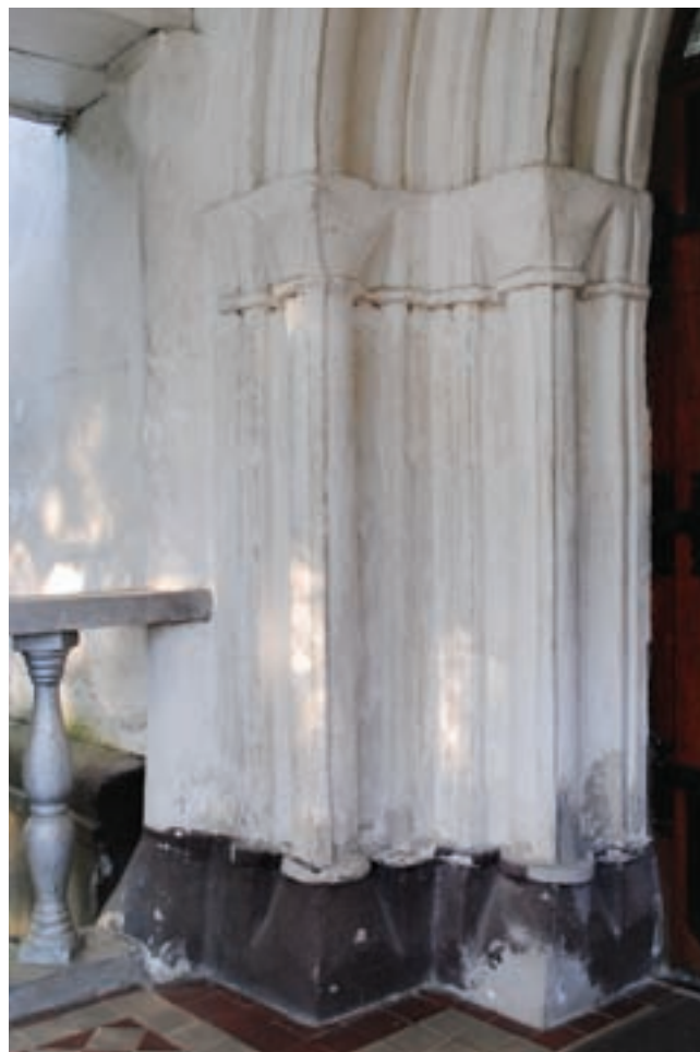
5. A hajó nyugati kapujának részlete

vastagabban van falazva. A vízszintes váltás a diadalívpillérek két oldalán, nagyjából vállvonaluk magasságában húzódik, majd átfordulva a hosszfalakra lépcsőzetesen lefelé ugrik valamelyest, és nem sokkal az ablakkönyöklők felett folytatódik a nyugati falig. 23 E szabályos váltás leginkább arra utal, hogy a hajó építése közben, vagy annak megszakadása után módosítottak falainak a vastagságán. 24 A hajó amúgy a középkorban sem igen lehetett boltozva – ma 1789-ből származó síkmennyezet fedi 25 –, a 11 méteres fesztáv a település egykori jelentősége ellenére is túl