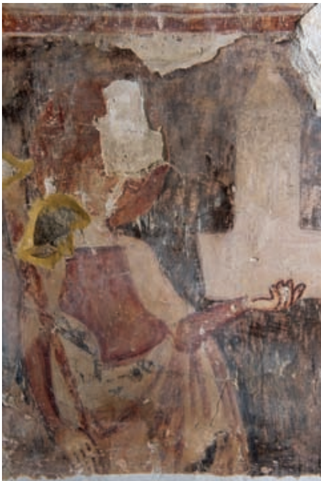
11. Szent Borbála a szentély délkeleti falán

Az impozáns méretű templom falképeit a szakirodalom szűkszavúan több alkalommal is említette, de konkrét ismeretekkel eddig nem rendelkezünk róluk. 1 „Mint halom, a meszelés alatt falfestmények lappanganak; nagyon örülnénk, ha erről biztosabb tudósítással bírhatnánk.” írta Rómer 1874-ben. 2 A hajó 1867-ben lemeszelt falképeiről szóló információk feltehetően téves értelmezése miatt szerepelt az irodalomban XV. századi datálás. 3