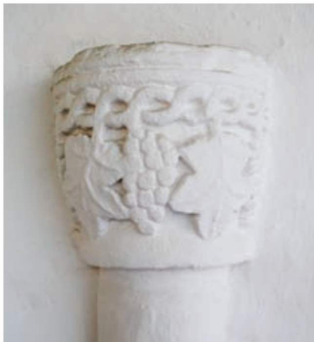
10. Oszlopfejezet a szentélyben

Visk mai plébániatemplomának felépültét tehát inkább az 1300 utáni időre tehetjük, de hogy mennyivel, az nehezebben megválaszolható. Köthetnénk az eseményt az egyház régebbi jogainak 1326-os megerősítése, illetve az 1329-es városi kiváltságok elé vagy utánra – a szokott módon. Ez azonban egyfajta automatizmus lenne, amely a tyúk és a tojás problémáját veti fel. Konkrétabb források