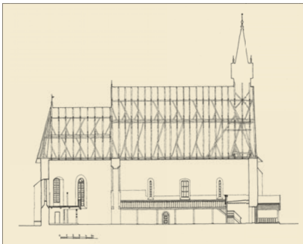
7. A templom hossz- metszete