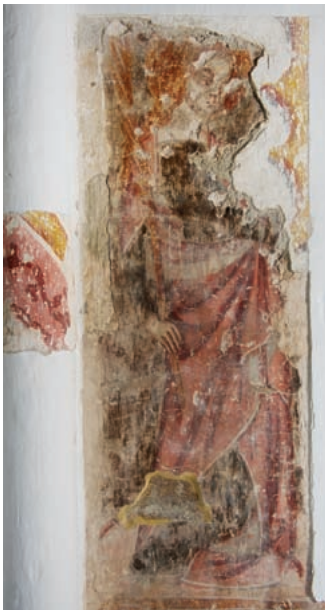
14. Női szent a szentély délkeleti falán

és ugyanez a szín egyes figuráknál a ruha, másoknál a köpeny színeként jelenik meg. Váltakozva színezték az egész kart fedő szűk, testre simuló ujjú, egyenes mellkivágású ruhákat vörössel, feketével vagy fehérrel. A ruhák színeitől markánsan, kontrasztosan eltér a vállról kétoldalt leomló, földig érő köpeny, melynek egyik szárát minden képen maguk előtt derékmagasságban áthúzták. A dicsfényeket vörössel tört okkerrel festették. Az arcoknál és a kezeknél vastag ecsettel, dinamikus festésmóddal tették fel a sötét kontúrvonalakat. Mindennek ellenére az elegáns formák, a melljük tett árnyékok miatt, plaszticitást nyertek. Ugyanez mondható el a drapéria-kezelés esetében is, ahol jól megválasztott színnel, csupán néhány rusztikus ecsetvo-