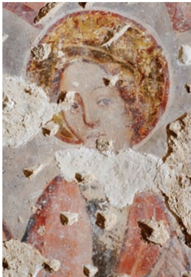
20. Torna, római katolikus templom. Szent Dorottya