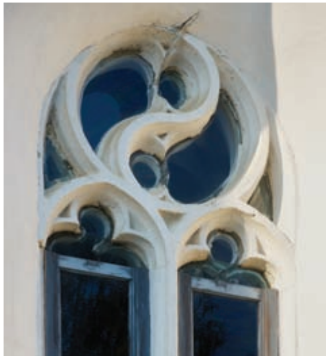
8. Mérműves ablak részlete a szentélyen

A jelenlegi épület keletkezési idejét formái alapján néhány évtizedes pontossággal meg lehet határozni. Noha egy ásatás és falkutatás hozhat még meglepetéseket, a mai templom jó része – a hajó a kapuival és az ablakaival, illetve a szentély a faloszlopaival és a sekrestyeajtóval – egyetlen periódusból származónak tűnik. A fenti szerkezeteknek alapvető jellemzője, hogy formáik egy része erősen kötődik a román kor építészetéhez. A nyugati kapu nyújtott kockaoszlopfői XII–XIII. századi előzményeket idéznek, s főleg esztergomi darabokkal lehet párhuzamba állítani őket, de az alapformájában bélétlépcsős kapuszerkezet is a román kor felé mutat. 29 Ugyancsak a román kori, XIII. századi építészetből származik az északi kapukeret profiljának sarkantyútagja, illetve ennek íves befordulása alul a nyílás felé. 30 A hajó vékony, résszerű, rézsűs