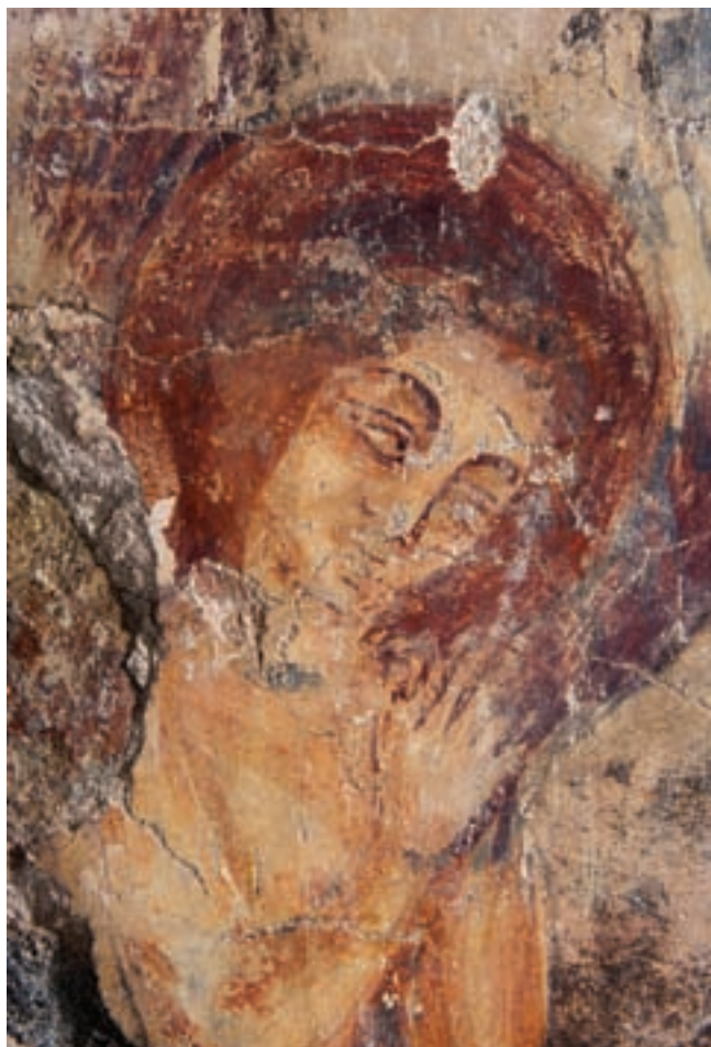
16. Angyal alakja

te nem fedi a teljes testet. Kezüikön rákozott páncélkesztyűt viselnek, karjukat pedig csak könyökig védi a láncvért, alóla a testhez simuló vörös ing tűnik elő. Felsőtestükön a vállat is fedő vörös fegyverkabátot viselnek, amely alól előtűnik a combközépig érő láncing. Lábukat is láncvért védi, de némelyik figurának rákozott lemezpáncél látható a lábfejen. Ezek lábszárán is több elemből álló lábszárvédő figyelhető meg. A rövid, egyenes vércsatornás kardnak egyszerű keresztvása, hosszú markolata és keresztel díszített gombja van. A szembenézetben ábrázolt katona sisakja csúcsos, a homloknál széles pánt erősíti. Néhány szín felvitelével, robusztus ecsetkezeléssel a művész gazdagon modellálta a figurák arcát. Itt már szó sincs típusarcokról, mint a női szentek esetében. A sokalakos kompozícióban megjelennek a profilban, félprofilban és teljes szembenézetben ábrázolt alakok, és úgy tűnik, hogy a bonyolultan egymást mögé helyezett szereplők térbeli helyzetének érzékeltetésére is törekedett a mester. Tehát nem csupán egymás mellé soroztatott szereplőkről, hanem a teret némileg érzékeltető csoportfűzésről van szó. Az alsó képszalagon a kép határán nyitottuk szondánkat, ahol egyértelműen látható, hogy